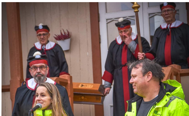
Hamar Håndtverkerforening med lærere fra Stange videregående.