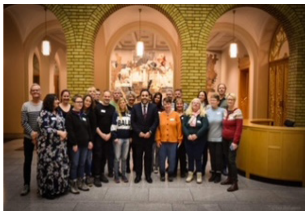
Besøk på Stortinget.