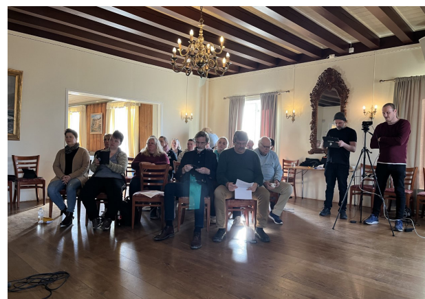
Recoveryverksted i tema Håp.