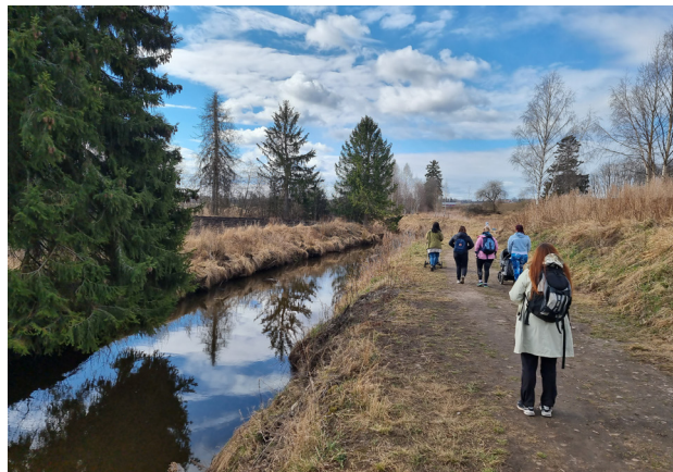
Fra walk & talk, tur ut.