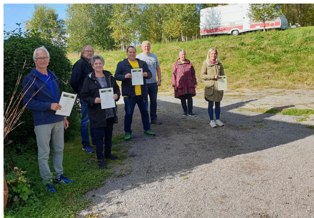
Deltakere på Selvstyringskurs med bevis for gjennomført kurs, på Lillehammer.