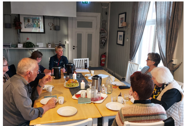
Fra Pårørendekafé på Sagatun.