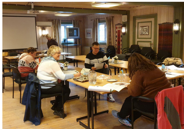
Deltakere på Selvstyringskurs, på Lillehammer.