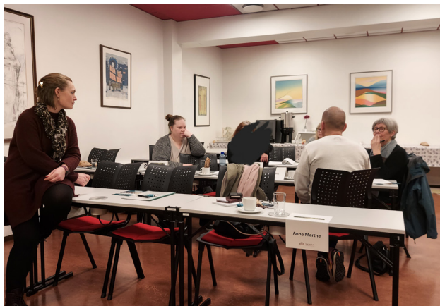
Deltakere på Selvstyringskurs for Lpp på Folkets Hus på Hamar.

Vi har også hatt et Prosesslederkurs på Hamar, med godkjenning av 8 nye prosessledere, hvorav 3 fra Tunet Brukerstyrt Senter i Hå kommune, og 5 fra Hamar. Gratulerer til alle dere, og det viktige arbeidet dere skal videreføre fremover!