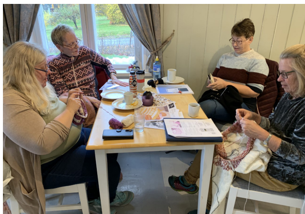
Fra strikkekafeén på Sagatun.

» Godt å ha ett sted hvor man blir sett for den man er, uansett dag. Fint å få ulike oppgaver, så jeg kan få utfordret meg selv. Fint å få tilrettelagt oppgavene etter dagsform. Det er fint å få jobbe i team, så vi får utfylt hverandre. Fint å få brukt kreativiteten sin». (Mann 39 år).