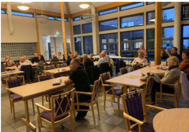
En samling fra Temakveld i Elverum.

Hva er mulig å få til innenfor kommunale rammer når det gjelder brukerstyring? Må ansatte alltid være til stede? Mange spørsmål og når det gjelder brukerstyring ikke alltid samme svarene, da det spørs litt på rammene brukerstyring skal praktiseres innenfor og brukergruppa. Vi erfarer at brukerstyring kan bidra til å sette i gang bedringsprosesser, men at en på samme måte som med brukermedvirkning må ha kontinuerlig fokus på det.