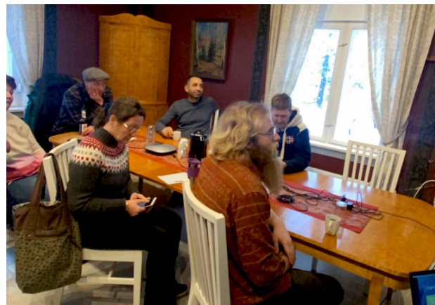
Her er noen av de som deltok i Fadderprosjektet.