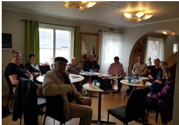
Nettverksamling brukerstyrene på Stabburshella.