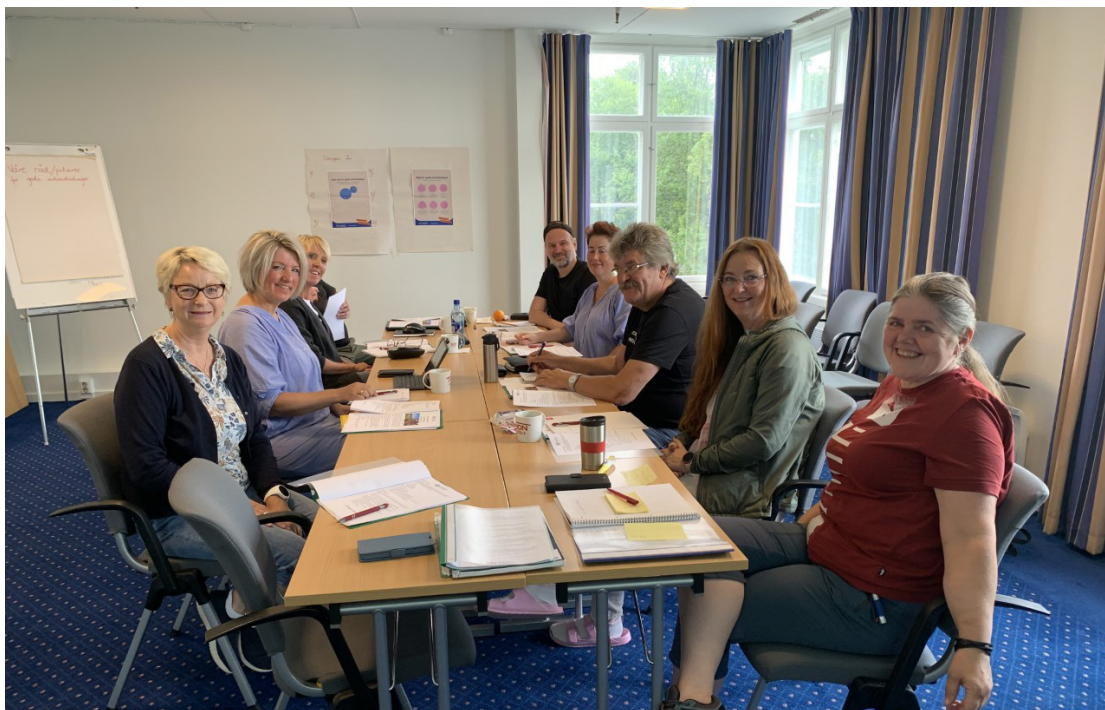
Personalseminar på Skeikampen høsten 2022.

ble avholdt 24.08 – 26.08.22 på Skeikampen. Hovedtema var iverksetting av «Strategi 2020 – 2025», ny nettside for Sagatun, Recoveryarbeidet vårt og arbeidsmiljø. Ellers er god mat og sosialt samvær også veldig viktig for et godt arbeidsmiljø!