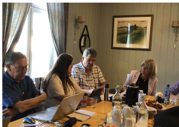
RBS samling på Sagatun.