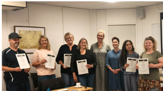
Deltakere på Selvstyringskurs på Hamar, med bevis for gjennomført kurs, for Ny Vekst og kompetanse og Hamar innbyggere.