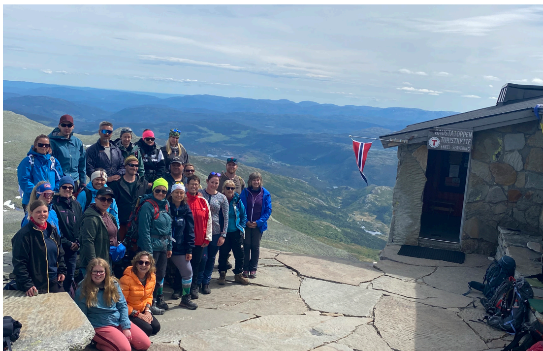
Toppturen til Gaustatoppen.

I 2022 har vi gjennomført våre faste aktiviteter og fått til toppturer med overnatting gjennom samarbeidsprosjekt med Hamar kommune og tilskudd fra Statsforvalteren i Innlandet. Dette er tilskuddsmidler som er øremerket prosjekt som gjennomføres i forpliktende samarbeid mellom det offentlige (Hamar kommune) og frivilligheten (Sagatun Brukerstyrt Senter). Dette gjaldt Gaustatoppen og Skeikampen. Uten dette ekstratilskuddet fra Statsforvalteren hadde vi ikke kunnet gjennomføre disse turene. Av spesielt nevneverdige turer kan vi nevne;