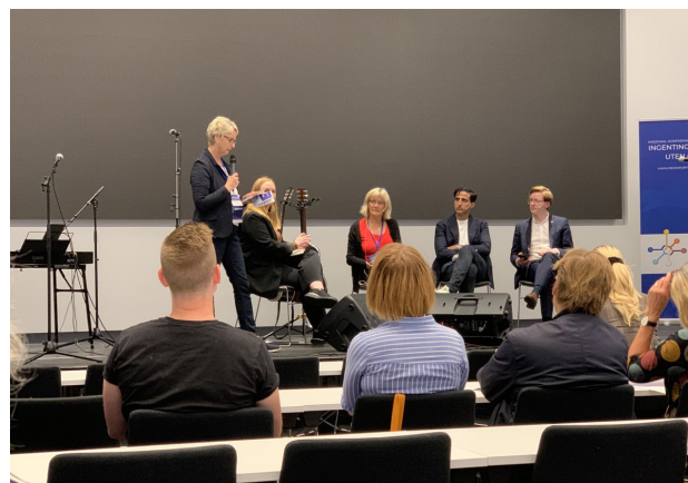
Politisk debatt på konferansen.