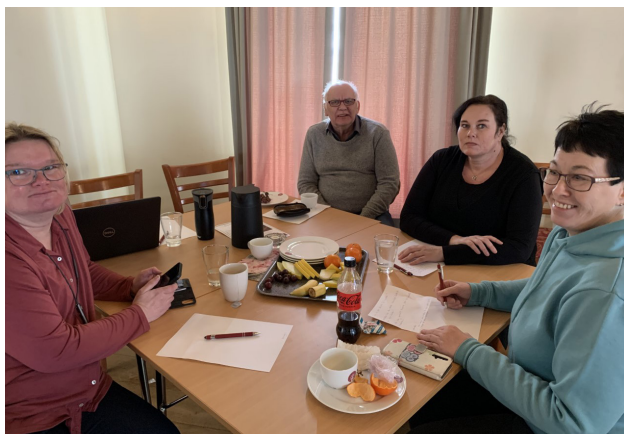
Recoveryverksted på Storhamarstuene.

Du kan lese mer om Recoveryverkstedene og det som kom fram på de ulike temaene på: http://www.sagatun.no/ressursbasen/recovery-pa-sagatun/