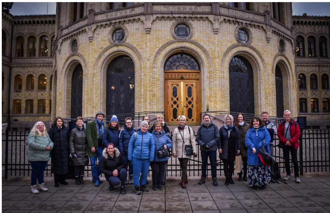
Sagatundeltakere utenfor Stortinget.