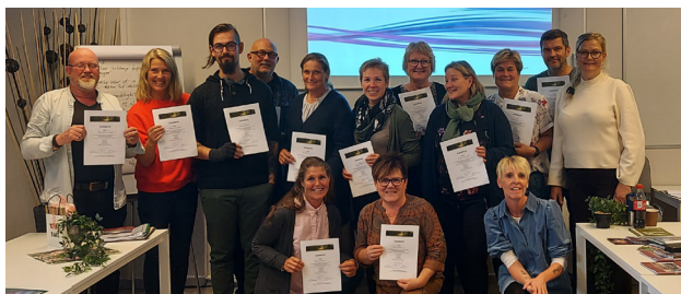
Deltakere på Recoverykurs med bevis for gjennomført kurs, for Ny vekst og kompetanse, i Kongsvinger.

Kurset gir innsikt i forhold som fremmer helse og verdier som ligger til grunn for bedringsprosesser. Det gir økt innsikt i recovery som prosess, og konkrete verktøy man kan bruke for å jobbe mere recoverybasert i tjenesten. Dette er et todagers kurs, som er egnet både for tjenesteapparatet og brukere. Vi jobbet vekselvis med teori, øvelser, gruppearbeid og refleksjoner.