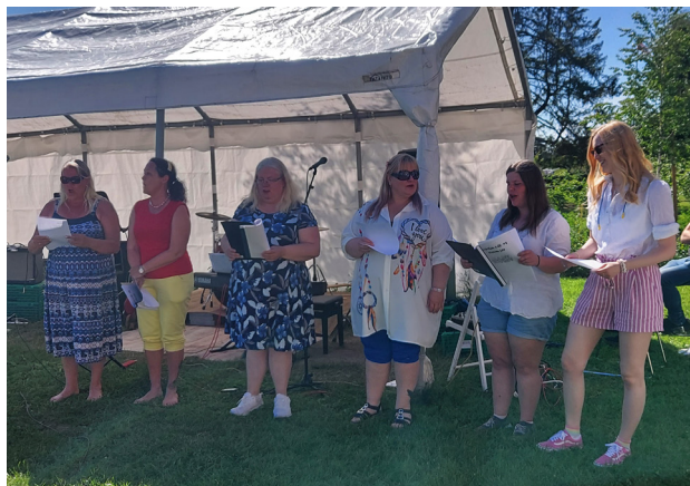
Noen av de som underholdt denne kvelden.