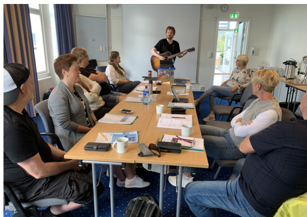
Jon underholdt underveis.