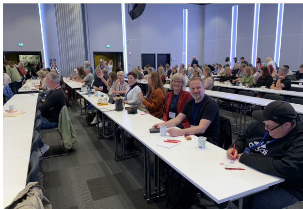
Deltakerne fra Sagatun.