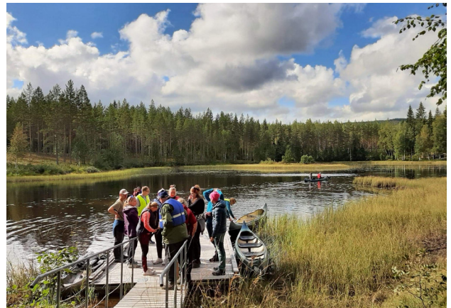
Fra turen til Kynna.