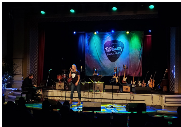
Fra Rockoverykonserten på Lillehammer.