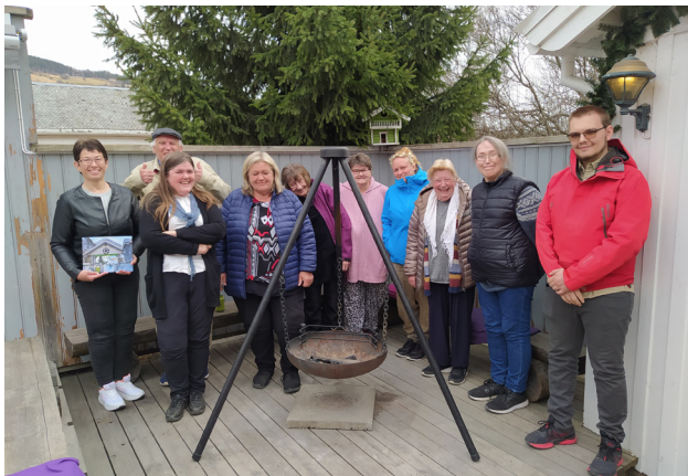
Nettverksamling brukerstyrene i Innlandet.