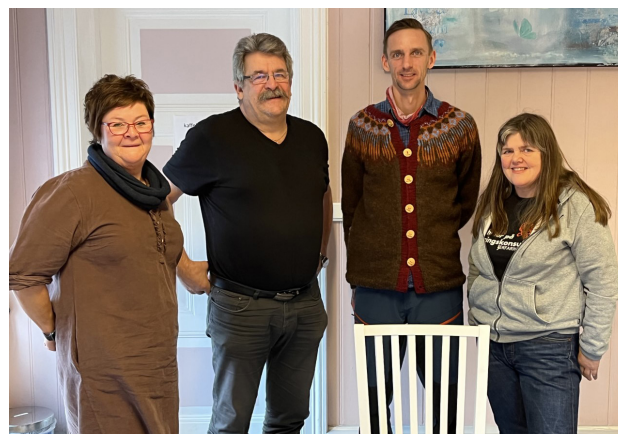
Besøk fra Grue kommune.

Sagatun mottar veldig mange hyggelige gjester på besøk i løpet av året, som ønsker å høre om hvordan vi jobber med å gi mennesker som strever med psykososiale livsutfordringer et tilbud som bidrar til livsmestring og god livskvalitet, som vil lære om brukerstyring i teori og praksis og som vil høre om hvordan vi styrker brukere og pårørendes stemme og bringer deres kunnskap inn i undervisning, tjenesteutvikling og forskning. Det er lov å si at besøk av Stortingspresident Masud Gharakhani med følge fra Stortinget og fra Hamar kommune den 19.04, var et høydepunkt.