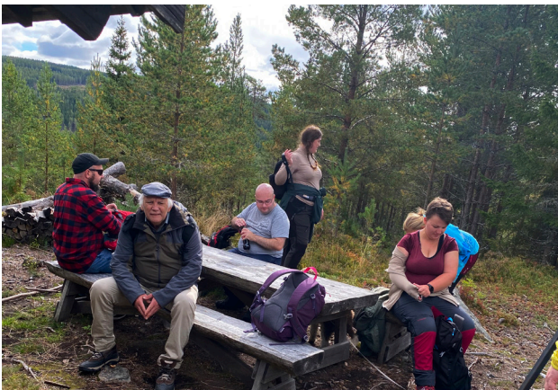
Fra turen til Festningsberget.

» I dagene før Gaustatoppturen, hadde jeg ikke trua på at jeg skulle klare å nå toppen, spesielt på grunn av tyngden på sekken. Jeg tenkte at turen, ville bli en prøvelse for kondisjonen, styrken både fysisk og psykisk, og selvtilliten. Jeg besteg toppen andpusten, veldig stolt og med gledesårer.