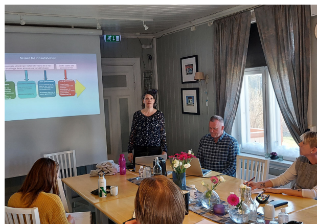
Representant fra Nav med deltakere på Sagatun.