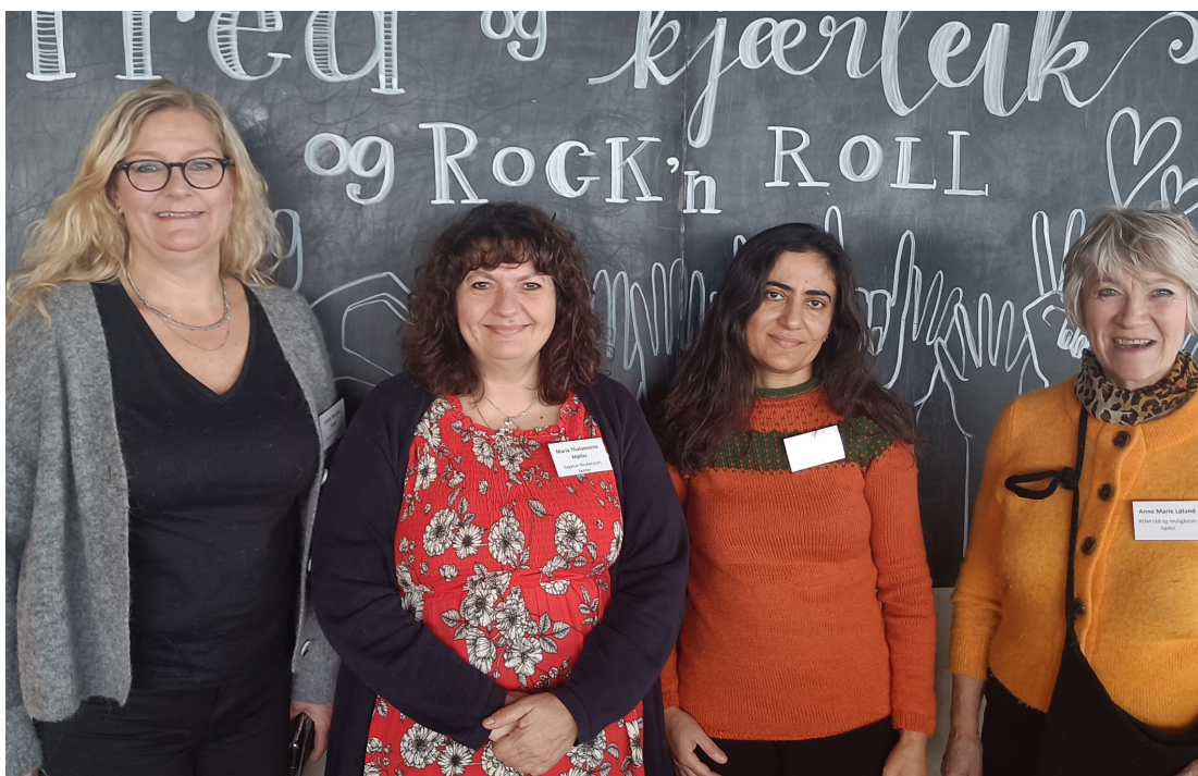
Nasjonal nettverkssamling I dialogiske og samarbeidende praksiser Trondheim- presentasjon av Kjøkkenpraten.