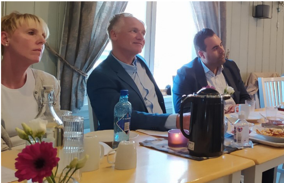
Besøk av Stortingspresidenten Masud Gharahkhan på Sagatun.