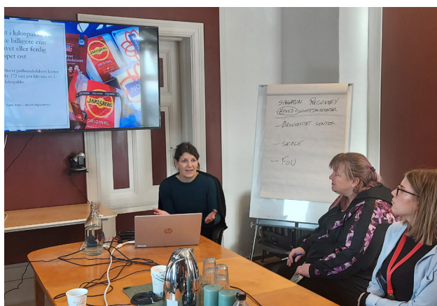
Fra venstre representant fra Nav med to deltakere.