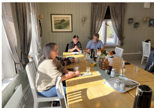
Samling for Erfaringskonsulenter på Sagatun.