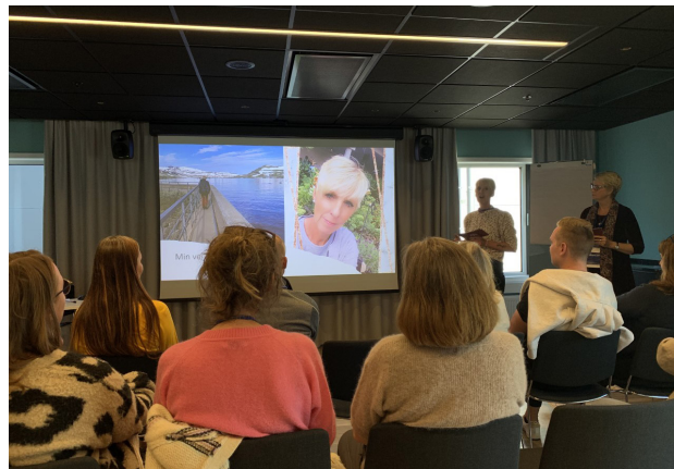
Stine forteller om sin recoveryprosess.