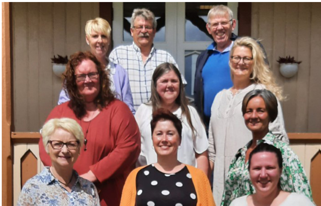
Samling fra Regionale brukerstyrte senter på Sagatun.

formelt samarbeid og underskrevet en samarbeidsavtale som innebærer å videreføre samarbeidet for å oppfylle målsetting og tiltak i rapporten «Knutepunkt for Recovery på regionalt og nasjonalt nivå – 2019».