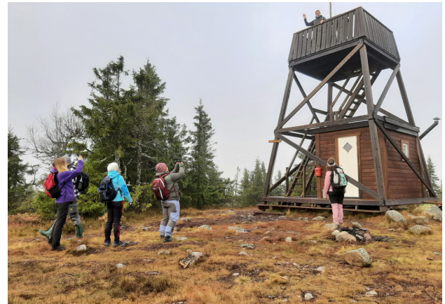
Fra turen til Gitvola.