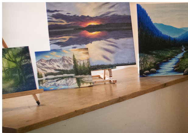
Noen av maleriene til Pål.