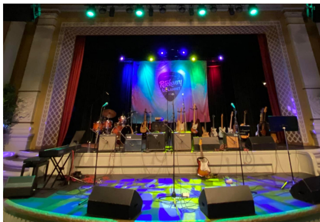
Fra scenen på Rocovery.