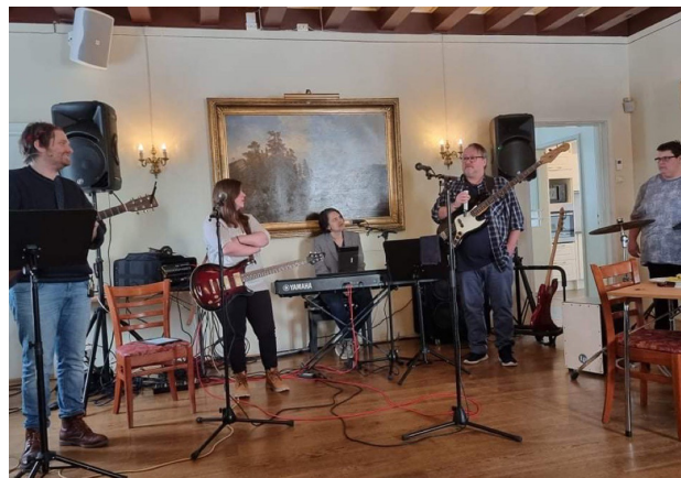
Recoveryverksted i tema musikk, på Storhamarstuene, her med Sagarockers.