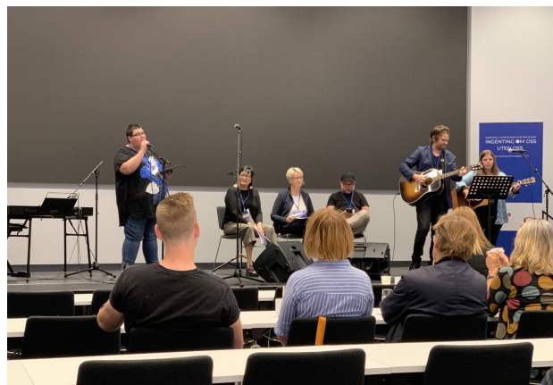
Musikere fra Sagatun underholdt underveis.