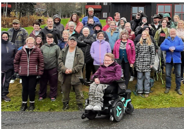
Fra turen til Skeikampen.