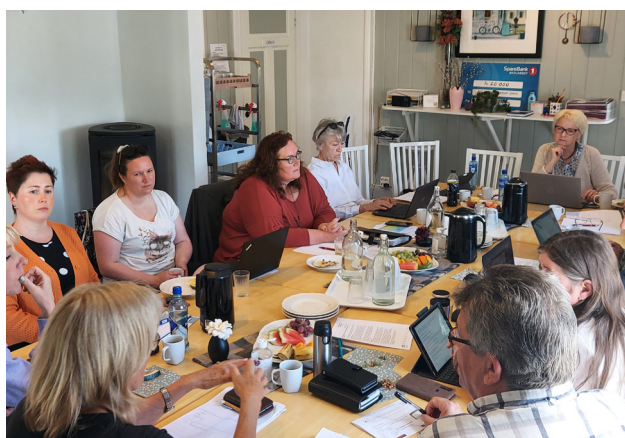
RBS samling på Sagatun.

De Regionale Brukerstyrte Sentrene (RBS) har sine styrker på ulike felt. Vi har samarbeidet i flere år og møttes for å utveksle kompetanse og erfaringer. Felles visjon for sentrene er «Vi styrker brukere og pårørendes stemme». Sentrene har inngått et