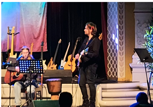
Fra Rockoverykonserten på Lillehammer.

Med tanke på brobygging og faglig kompetanse vil et slikt nettverksamarbeid være bærekraftig når Sagatun sitt musikkterapiprosjekt i 2023 skal inngå et samarbeid med Stange kommune (Stangehjelpa). Målet er at med Sagatun sin kompetanse/erfaring innen musikkaktiviteter og recovery-modell kan bidra til å gi et fullverdig og meningsfullt aktivitetstilbud for mennesker med utfordringer innen mental helse i Stange kommune.