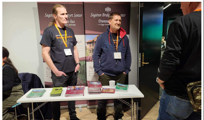
Fra Sterkere sammen konferansen.