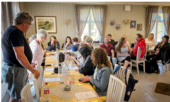
Besøk fra Glimt recovery senter, Trondheim.