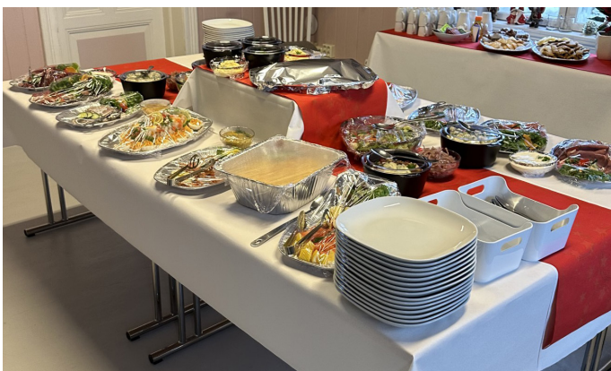
Julematen som ble servert.