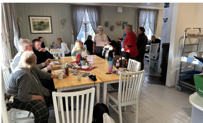
Åpent julehus, der vi solgte diverse håndverk.