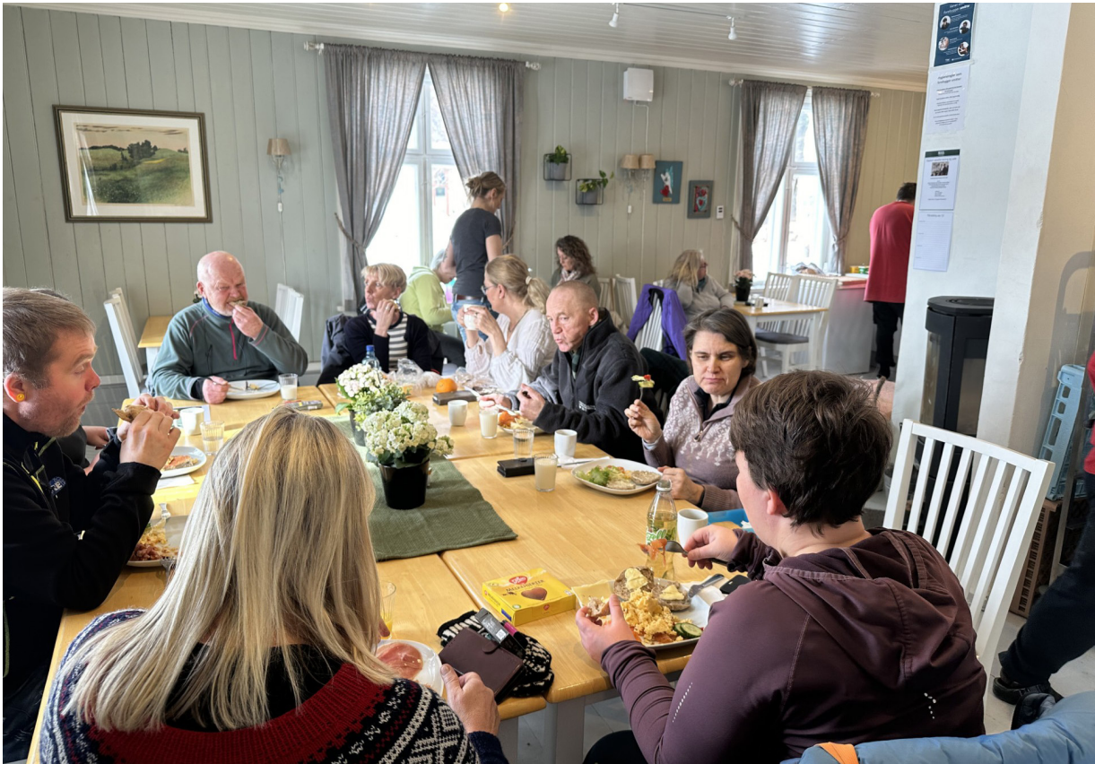
Fra Sagatun spiseforretning og kafé.

Tall for 2023, med sammenligning mot 2022 tall i parentes viser: Det ble registrert ca. 6167(4861) besøkende på Sagatun, av disse er 4933(4016) registrert som brukere. De besøkende registrerer at de deltar i arbeid 714(680), aktivitet 2933(2089), møter og kurs 1190(872). 1291(1220) sier at de er innom på kaffe, lunsj og/eller en prat.