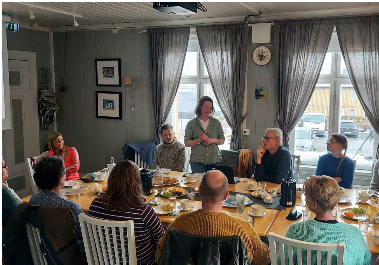
Fra Pårørendekafé på Sagatun.

Sagatun Recovery Skole tilbyr kurs og mestringstilbud lokalt og regionalt i Innlandet. Gjennom «Verktøykassa for brukermedvirkning» tilbyr vi kurs knyttet til brukermedvirkning, bedringsprosesser (Recovery) og selvstyrking (Empowerment). Kursene retter seg mot både ansatte i hjelpetjenester, brukerrepresentanter og enkeltpersoner. Vi tilfører kunnskap og skaper fellesskap som bidrar til reell brukermedvirkning, livsmestring og god livskvalitet for brukere og pårørende (Recovery). Målet er å fremme brukere og pårørendes stemme og rettigheter, og sammen med tjenesteapparatet få til reell brukermedvirkning og brukerstyring i praksis.