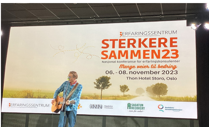
Fra Sterkere sammen konferansen.