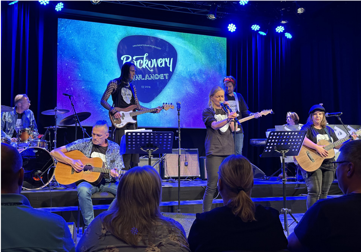
Fra Rockovery på Hamar, der Sagatun var arrangør.

Musikkaktiviteter på Sagatun har eksistert helt siden senteret åpnet dørene for første gang i 2009 og siden laget et fundament for det musiske livet som eksisterer på huset i dag. Man kan konkludere med - at siden musikkterapiprojektet startet i 2018 – så har interessen, mangfoldet og mulighetene vært under stadig utvikling.