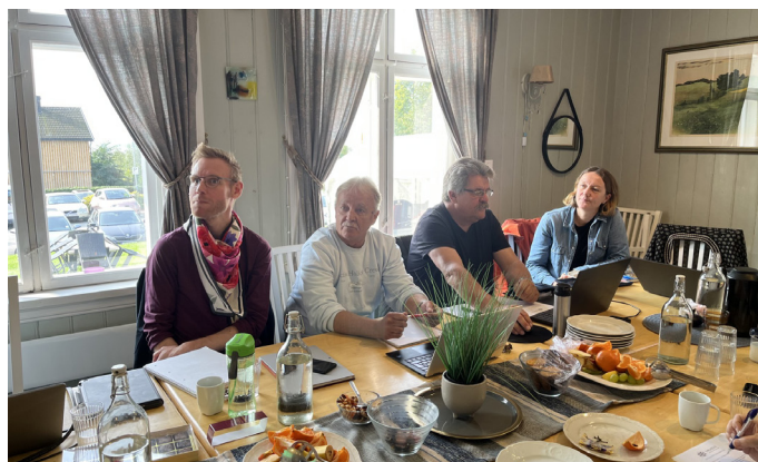
Møte i Stiftelsesstyret på Sagatun.