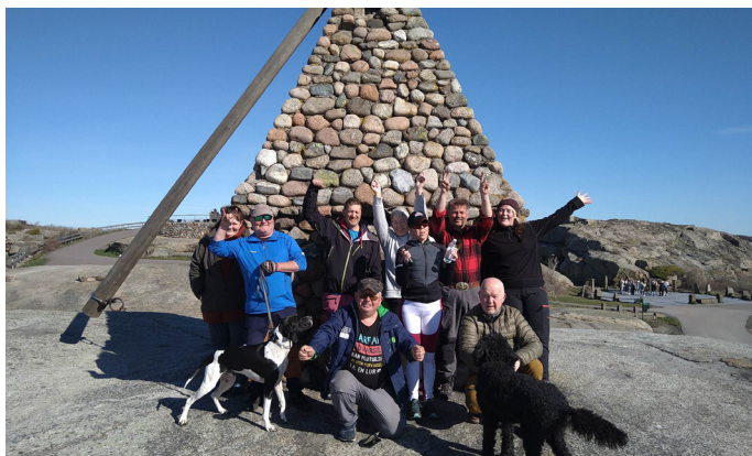
Sjøørretfiske på Tjøme.