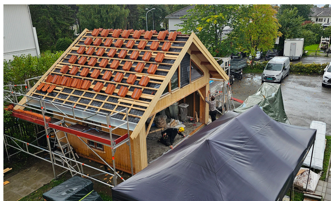
Byggingen av hagestuen.