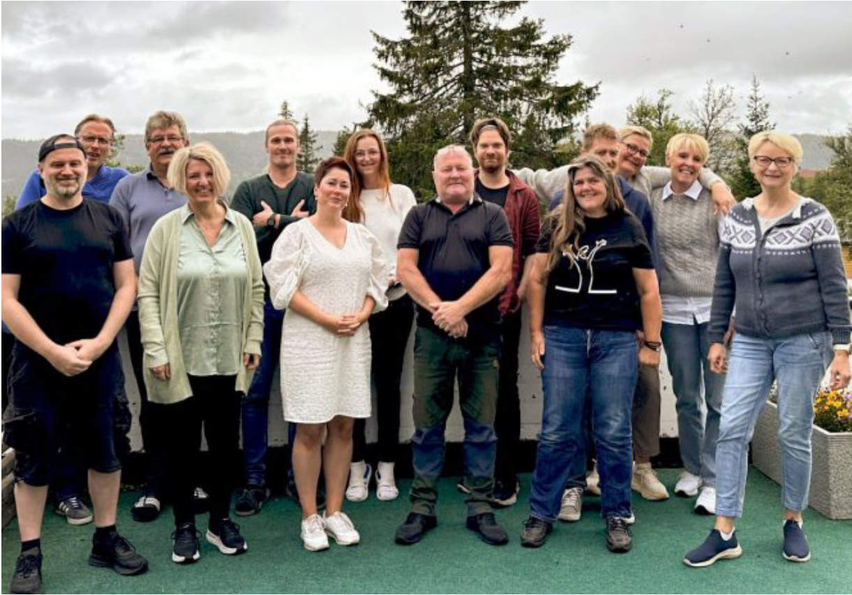
Ansatte i Sagatun Recovery, her fra personalseminar på Skeikampen i 2023.