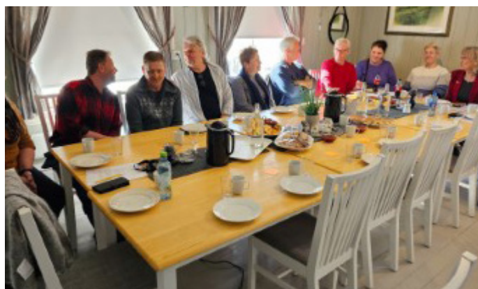
Besøk fra Statsforvalteren i Innlandet..