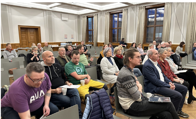
Det var mange som deltok denne kvelden.