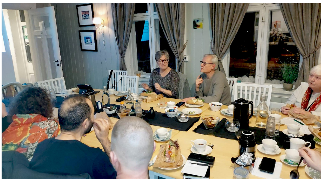
Pårørendekafé på Sagatun.