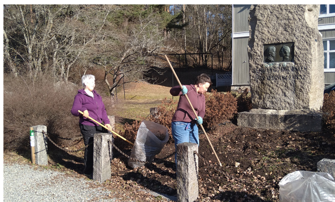
Hagearbeid ved Bautaen på Sagatun.