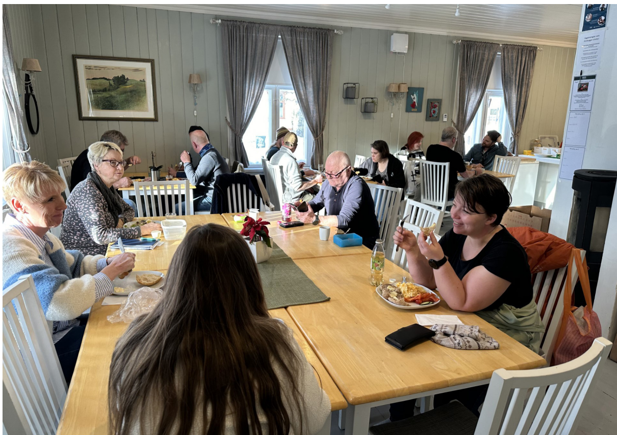
Sagatun spiseforretning og kafé, hjertet i Sagatun, der alle møtes for en kaffe eller lunsj.