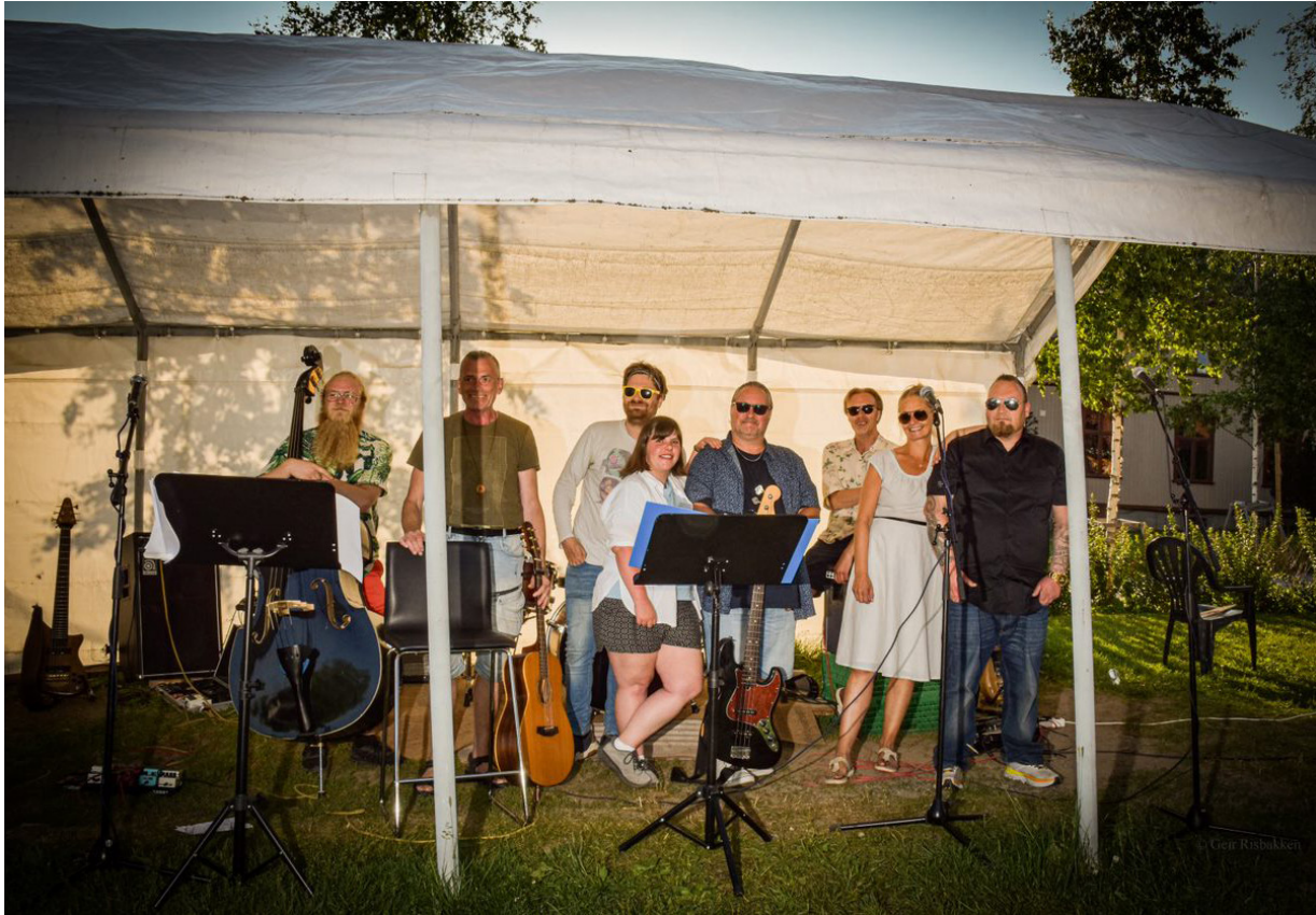
Sagarockers underholdt på sommerfesten.