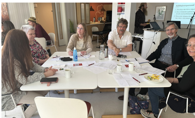
Fra Recoveryverksted i tema Håp.

Du kan lese mer om recoveryverkstedene og det som kom frem på ulike temaer på: https://sagatun.no/sagatun-recovery-skole/recovery-verksted/?cst