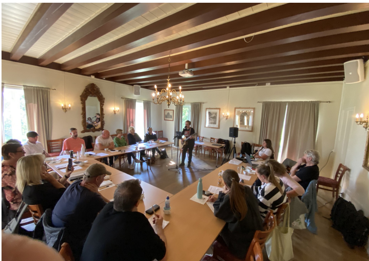
Brakerstyrt samling Innlandet, her fra Storhamarstuene på Domkirkeodden.