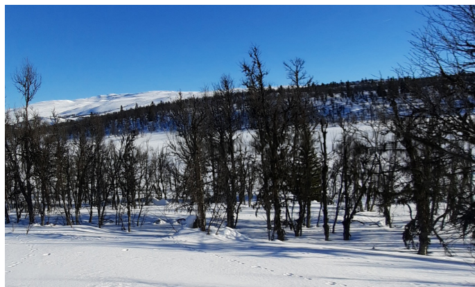
Vintertur til Lenningen.