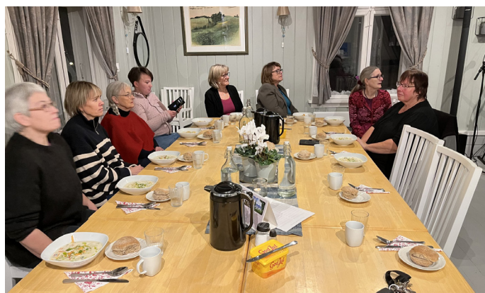
Besøk av Kvinnenettverket i Arbeiderpartiet i Hamar.