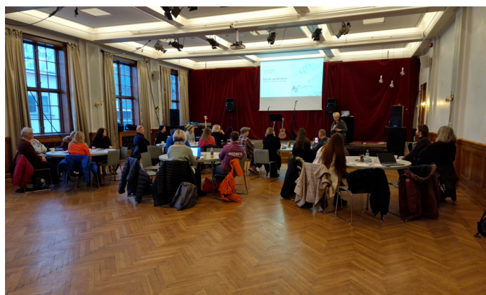
Fra Recoveryverksted i tema Musikk.