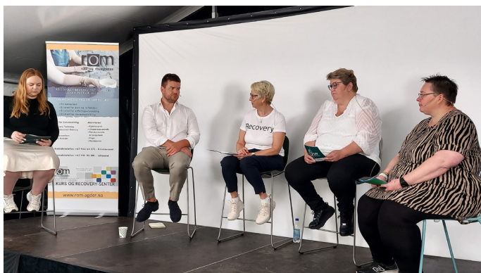
Kårhild deltok i paneldebatt.