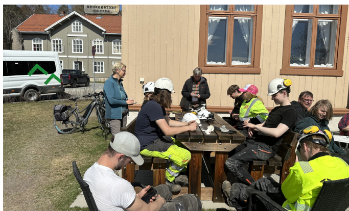
Avslutning for studentene ved Stange videregående.