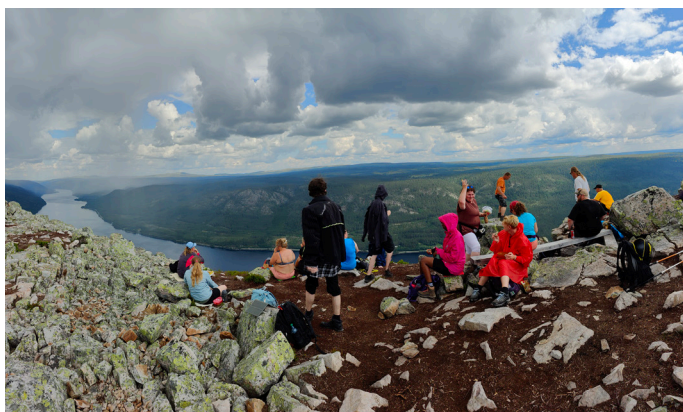
Topptur til Skagsvola i Trysil.

”Fantastisk og avslappende tur med herlige personer. Jeg har blitt kjent med gjengen på en annen måte, fått prøvd meg på nye ting, og utfordret meg selv. Gleder meg allerede til ny tur!”