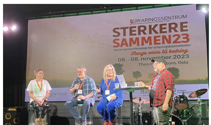
Fra Sterkere sammen konferansen.