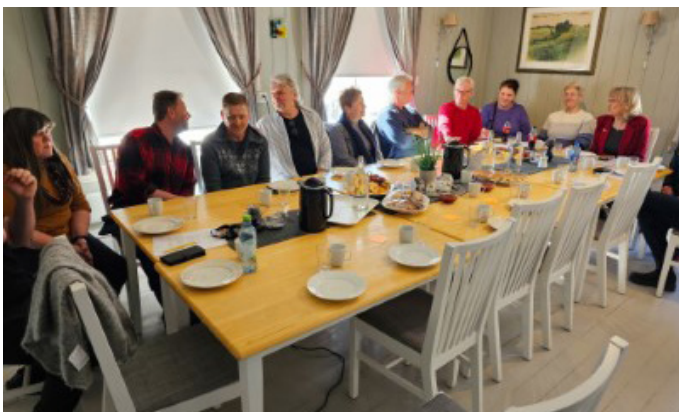
Deltakere ved besøket av Statsforvalteren.