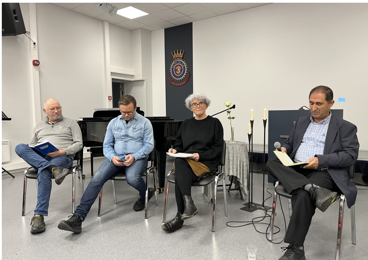
Fagsamling i regi av Crux, Kårhild deltok her.

10.11.23. Temakveld Hamar: «Frivillighet nær døden og i sorgen»