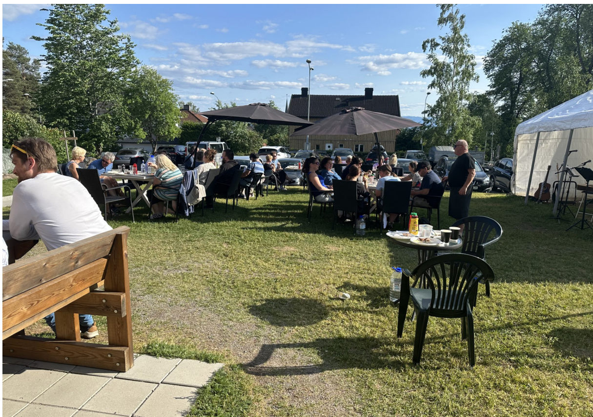
Sommerfesten på Sagatun, det var 48 som deltok.

Endelig kan vi se tilbake på et normalt år, der vi har lagt pandemien bak oss. Dette har vært et spennende år på mange fronter, med nye prosjekter, nye samarbeidspartnere og omorganisering av stiftelsen Sagatun Recovery. Sagatun Brukerstyrt Senter er en av tre avdelinger i den nye organiseringen.