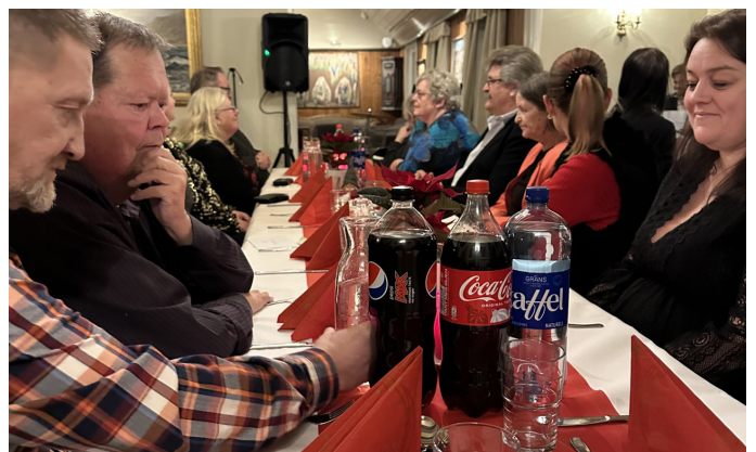
Noen av gjestene på julebordet.