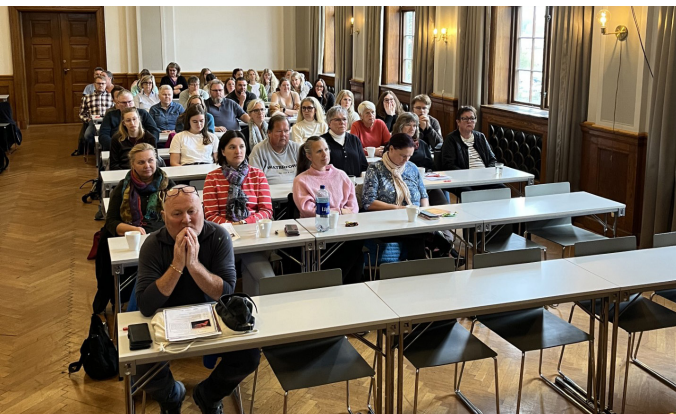
Deltakere på kulturnettverkseminaret.