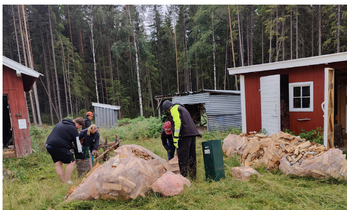
Vedkapping på Koia.

I 2023 har 12 personer hatt frivilligkontrakt på Sagatun. Det er fortsatt mange som deltar i frivillig arbeid uten kontrakt, hvor det totalt er ca. 60 personer som deltar i dette. Anslagsvis er det for 2023 rundt 7000 frivilligtimer fordelt på de forskjellige arbeidsoppgavene som; musikk, snekring, maling, plenklipping, hagearbeid, vedhogst, lære seg sikkerhetsrutiner, renhold, snømåking, miljøarbeid, undervisning og informasjonsarbeid, foredrag, kafédrift og matlaging med mer. I tillegg til dette holder Brukerstyret åpent noen søndager i løpet av året, i tillegg til påsken og jula på frivillig basis. Det er også brukere som holder åpent i sommerferien til de ansatte, men de får da betalt som vikarer. Alt i alt kan vi konstatere at brukerne gjør en betydelig innsats for at vi skal kunne gi et så bredt og godt tilbud som vi gjør, på Sagatun. Uten denne innsatsen ville det vært vanskelig å drive Sagatun.