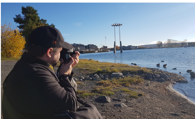
Post it gruppa ute på tur og tar bilder.

«Kreativitet gjør oss mer løsningsorientert. Vi kan bruke kreativiteten til å finne positive løsninger og gi det positive mer plass.»