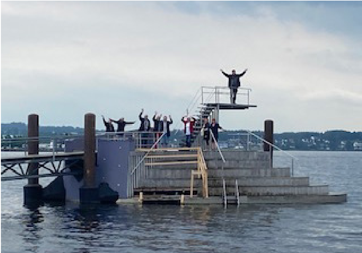
Samarbeid med brukerorganisasjonene Besøk fra dagsenter på Ørnes i Nordland.