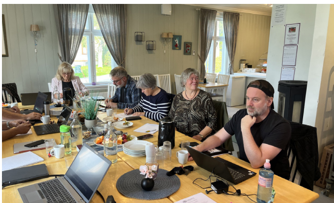
Møte i Stiftelsesstyret på Sagatun.