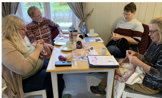
Strikkecafé på Sagatun i regi av Kreativt verksted.