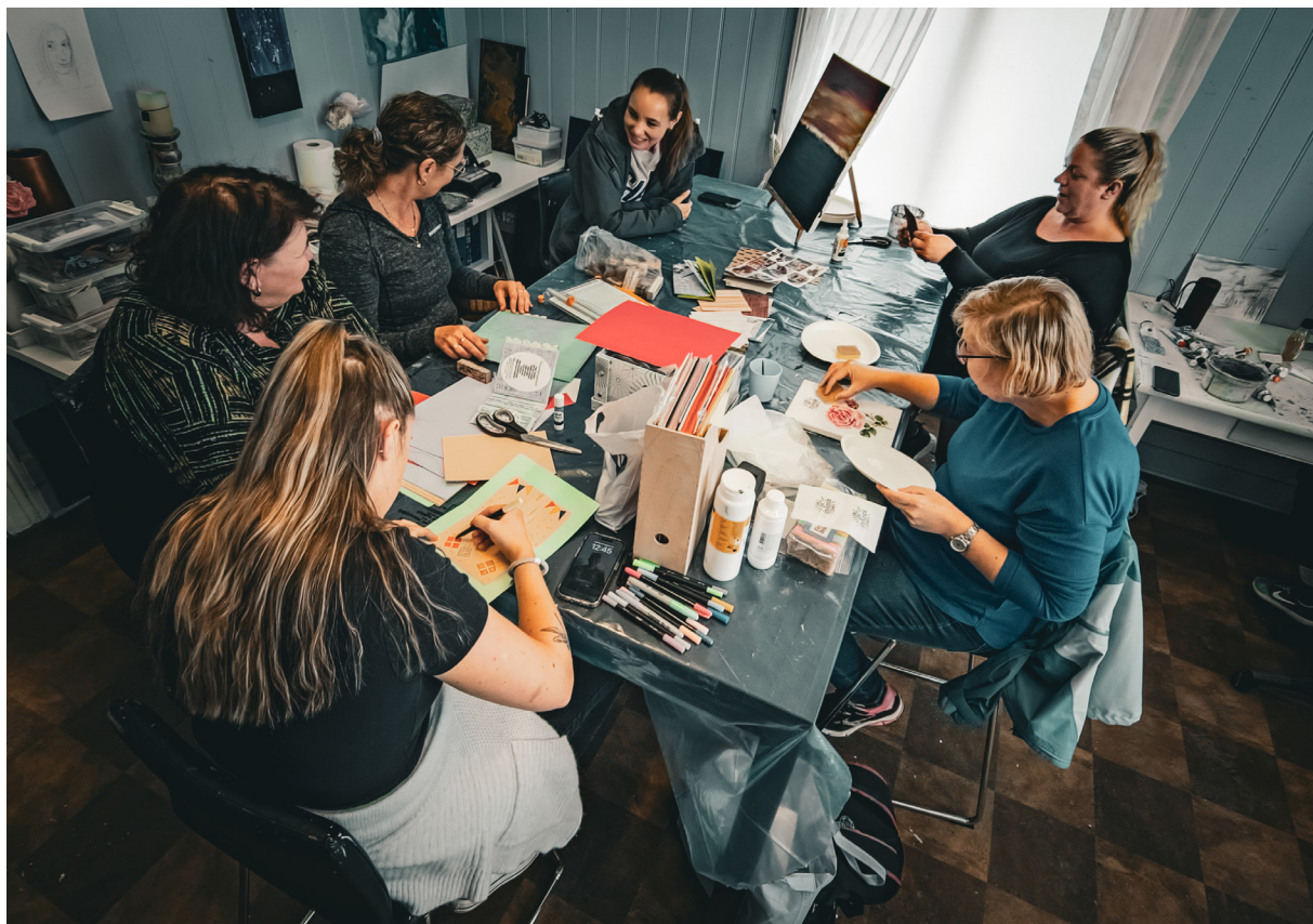
Hobbygruppa på Kreativt verksted.

Kreativt Verksted på Sagatun Brukerstyrt Senter er en hyggelig møteplass som er viktig for mange. Alle finner til hørighet, utforsker identiteten sin, føler mestring og finner håp til bedringsprosessen og sin indre empowerment (kraft, makt, styrke i eget liv). Vi har tilbud om aktiviteter innenfor kreativitet og tilbudet er for alle.