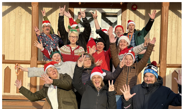
Ansatte på Sagatun.