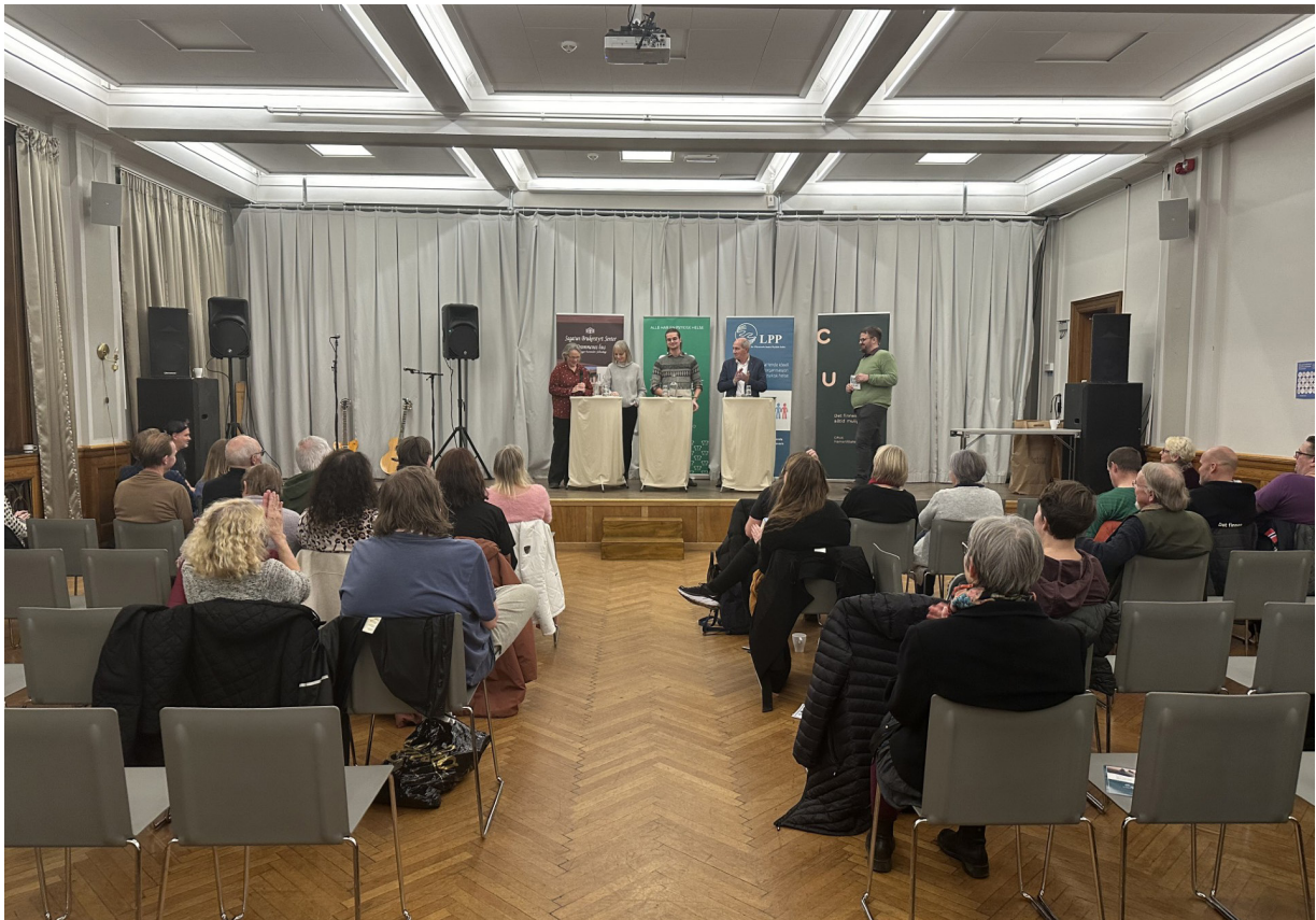
Politisk debatt i Hamar teater.