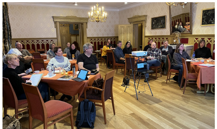
Deltakere på samlingen.