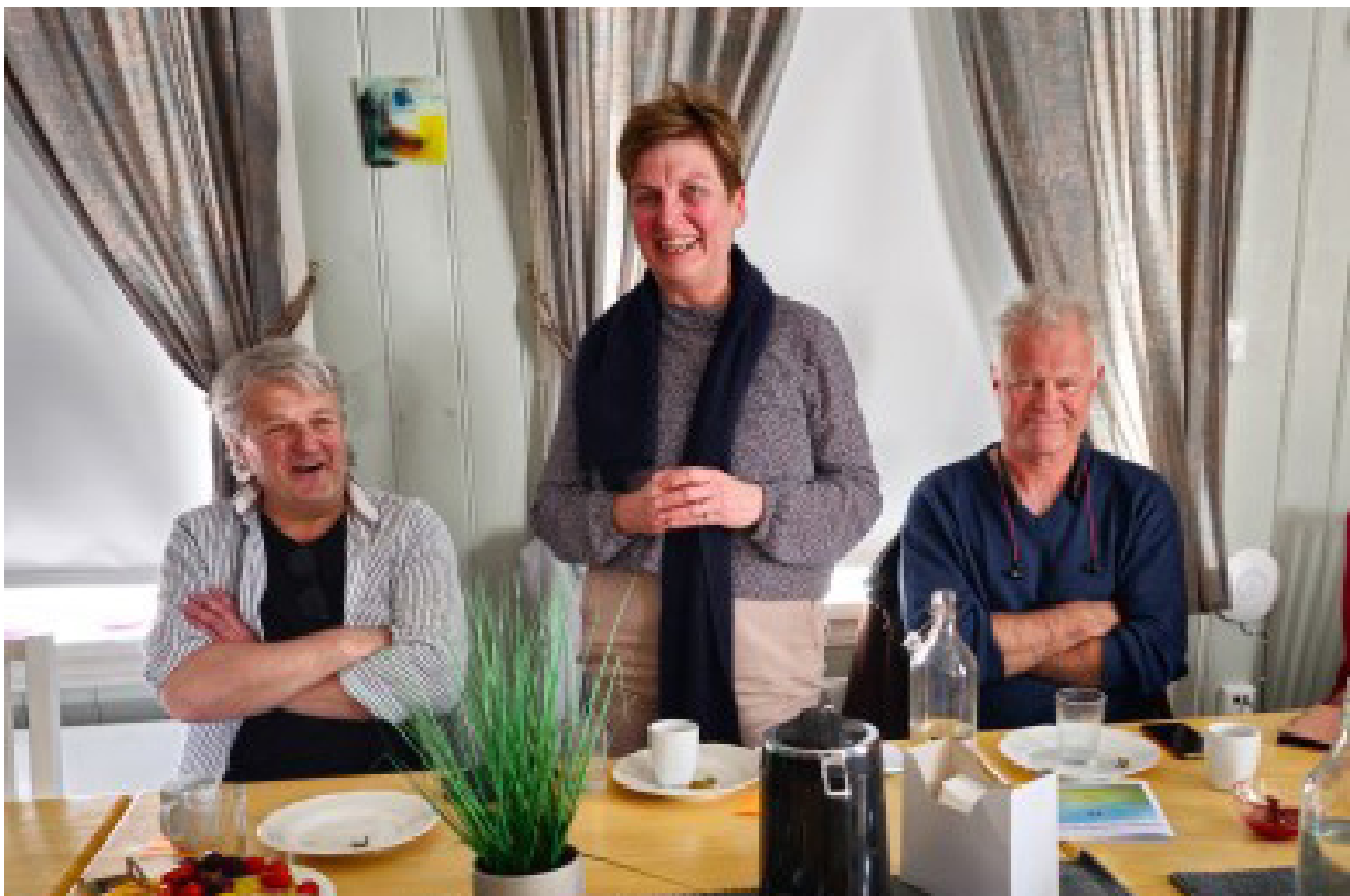
Besøk av Statsforvalteren i Innlandet på Sagatun.

Rådgiver for psykisk helse og rus hos Statsforvalteren i Innlandet har vært en viktig samarbeidspartner for Sagatun i alle år. Vi får tilgang til viktig informasjon og rådgiver informerer samarbeidspartnere og myndigheter om betydningen av arbeidet som Sagatun og de øvrige regionale brukerstyrte sentrene gjør. Via Statsforvalteren har vi fått tilgang til midler for veldig viktig utviklingsarbeid innen musikkterapi og nå også pårørendearbeid. Gjennom pandemien fikk vi stimuleringsmidler som gjorde at vi kunne opprettholde og skape nye tilbud for de brukerne som virkelig slet med isolasjon og ensomhet. Vi hadde besøk fra Statsforvalteren i Innlandet i mars og vi har hatt møter med Statsforvalteren, NAPHA og Lillehammer kommune for å få i gang recoverynettverk i Innlandet.