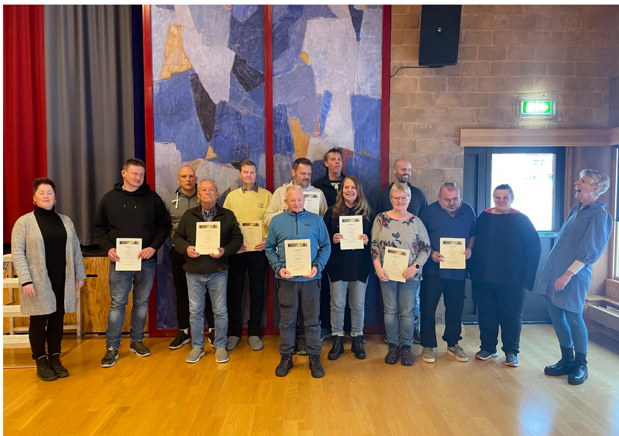
Fra Selvstyringskurs på Reinsvoll. Her har deltagerene fått utdelt beviset for gjennomført kurs.

Verktøykassa er som metode, recovery og brukerstyring vår kunnskapsplattform, og er basert på samskaping mellom fag og erfaring. Selvstyringskursene ble utviklet i 2012, Vi fremmer brukermedvirkning aktivt i selvstyringskursene, og disse kursene er like egnet for brukere som fagfolk og ansatte i tjenesten. Dette året har vi utviklet kurs som gikk direkte opp mot pårørende og erfaringskonsulenter. Verktøykassa for brukermedvirkning har hatt et aktivt år, vi har arrangert 10 selvstyringskurs, for til sammen 114 deltakere. Disse var fordelt på to kurs i Hamar med til sammen 18 deltakere, to kurs på Lillehammer med til sammen 16 deltakere, ett kurs for Villaen Brukerstyrt på Lena med 15 deltakere, ett på Reinsvoll med 15 deltakere, ett i Kristiansand med 16 deltakere, ett i Bergen for erfaringskonsulenter med 16 deltakere, og to kurs i Stange for pårørende med til sammen 16 deltakere. Kursene i Stange ble arrangert i samarbeid med Stangehjelpa.