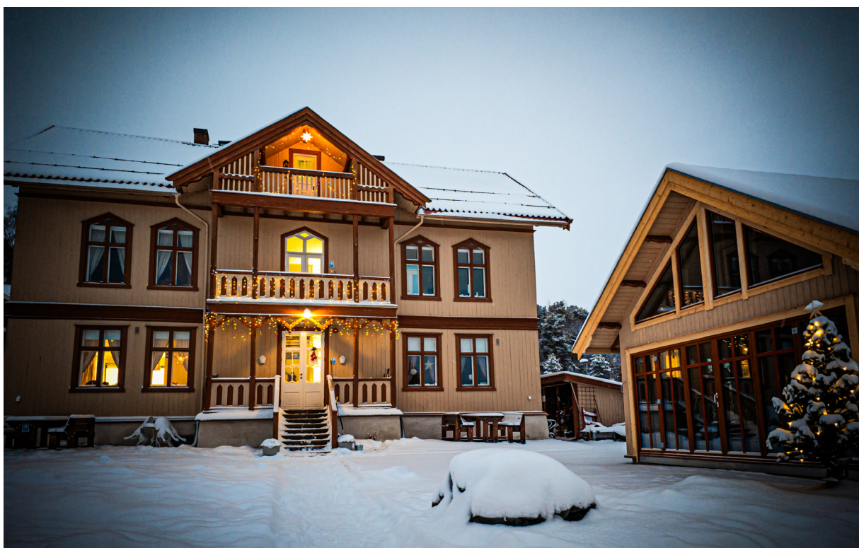
Den nye hagestua kalt Sagastua til høyre på bildet.

I flere år har Sagatun hatt en drøm om å bygge en paviljong som skal brukes som en utestue gjennom hele året. Drømmen har sakte, men sikkert blitt til virkelighet. 25.11.22. fikk Sagatun en gave fra Hamar Håndverkerforening med en sjekk på kr. 245.000,- Håndverkerforeningen hadde også inngått en avtale med Stange Videregående skole om at bygget skulle settes opp av elevene på Bygg og anlegg. Vi var også så heldige at vi har fått kr. 100.000,- i gavemidler fra Lions til prosjektet. Arbeidet med byggeprosjektet startet i januar 2023 med første spadetak i bakken. I desember 2023 tok vi en prat med elevene og læreren som har jobbet med prosjektet.