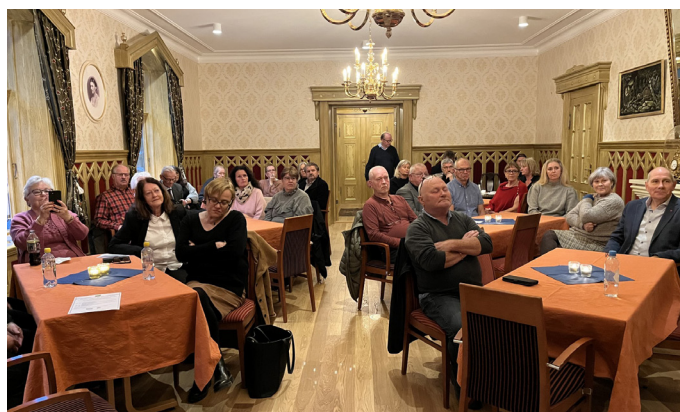
Det var mange som deltok på Gjestebud på Sgatun.