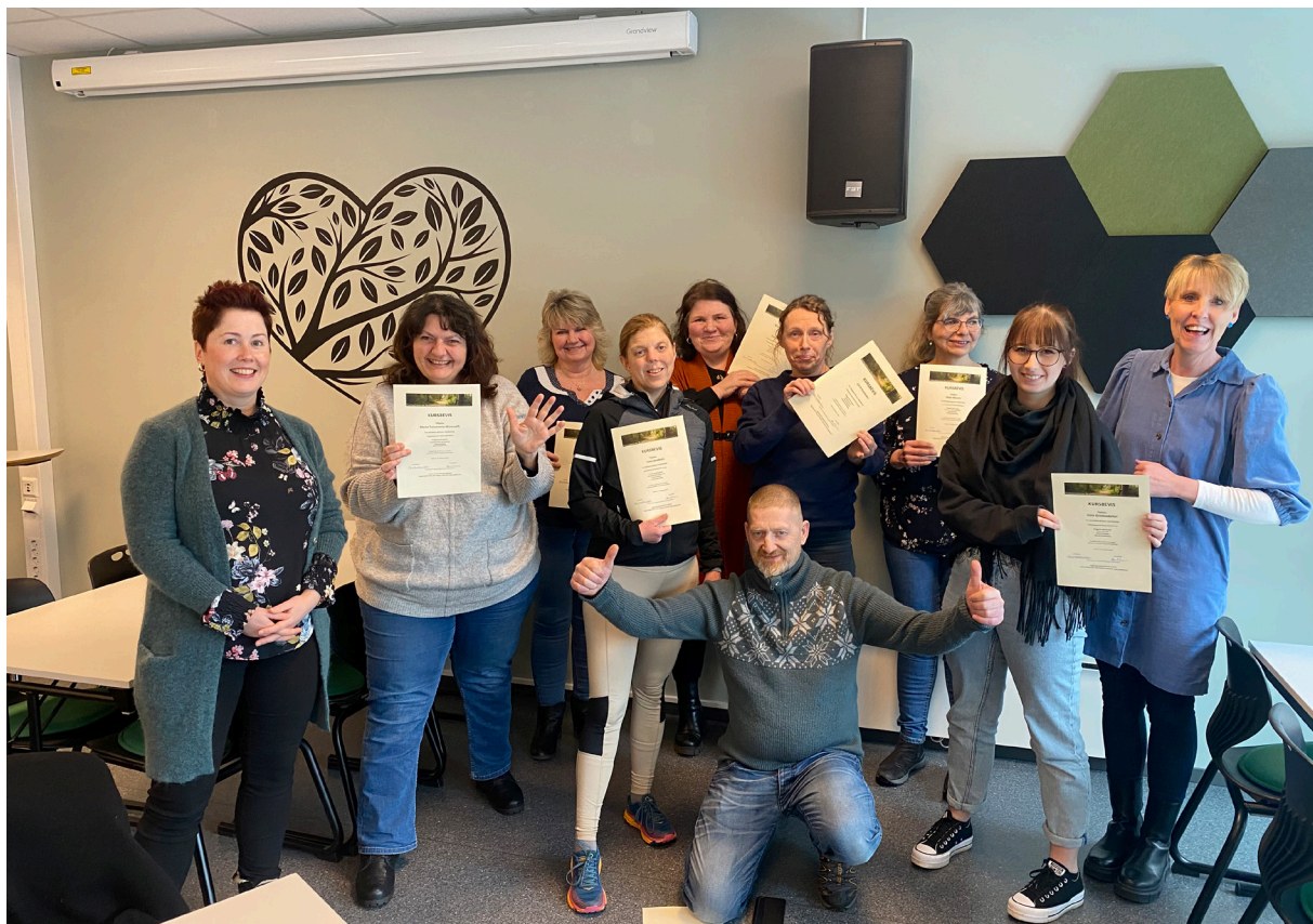
Fra Selvstyringskurs i Hamar i 2023.

Sagatun kan se tilbake på et svært aktivt år i 2023. Totalt på Sagatun er det 16 ansatte fordelt på 10,7 stillinger, hvorav 2 er varig tilrettelagt (VTO). Det er utført ca 7245 frivillig timer på Sagatun i 2023 og 11 personer har begynt i utdanning eller jobb, enten på heltid eller deltid.