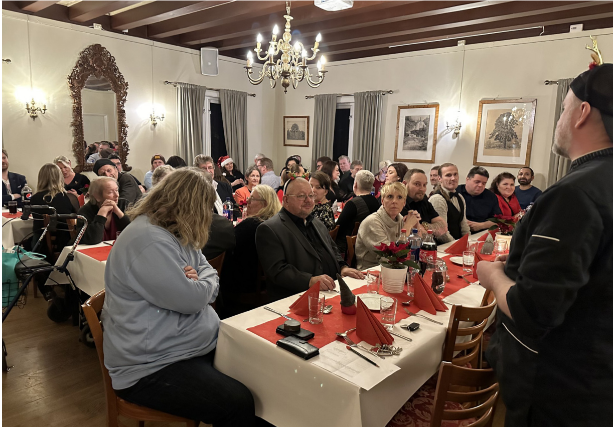
Julebord på Storhamarstuene, for brukere og ansatte.