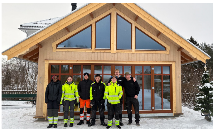
Noen av elevene fra Stange videregående foran den nyoppførte hagestuen.