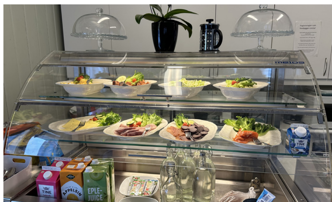
Her er mandagens meny med Sagatun sin buffét.