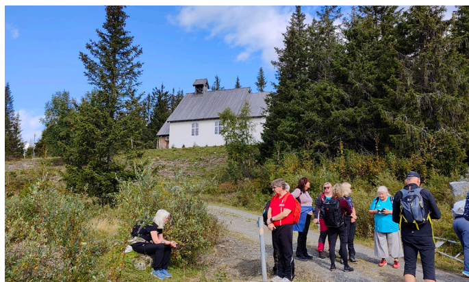
Høsttur til Skeikampen.