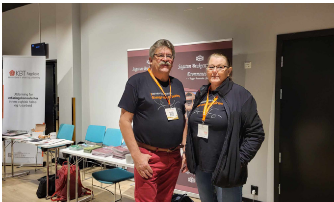
Fra Sterkere sammen konferansen.

Erfaringskonsulenter på SBS har bistått Hamar kommune med gjennomføring av en serie Mestringskurs, der vi bidrar med erfaringsdeling om hva som kan fungere for å mestre utfordringer innen Angst og Tanker, Grubling og bekymring.