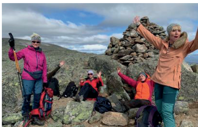
På toppen av Hallingskarvet.