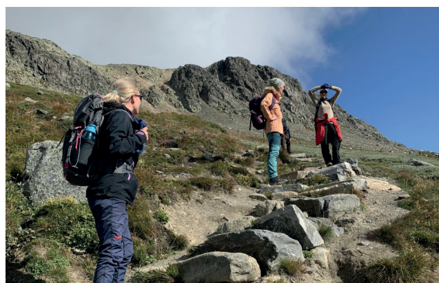
På vei opp de alle trappene til Hallingskarvet.