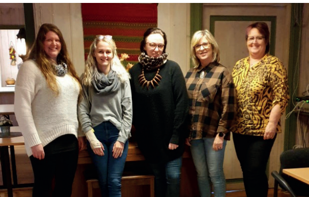
Fra Selvstyringskurs i Våler.