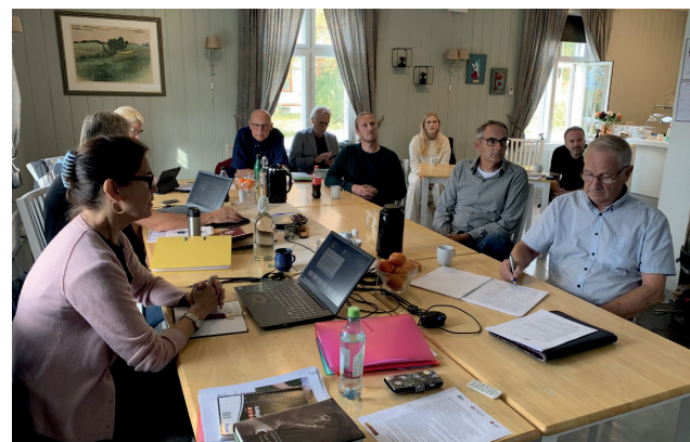
Møter vedrørende Strategi 2020 - 2025.