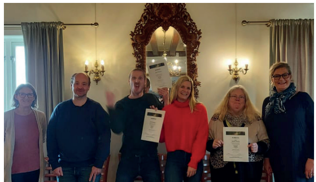
Fra Selvstyringskurs i Hamar.