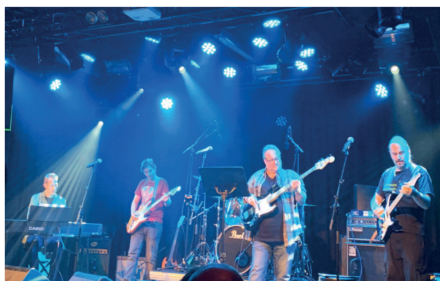
Fra konserten Rockovery.2020.