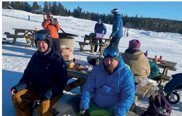
Turer til Budor i regi av Kulturnettverket.

Sagatun er en aktiv samarbeidspartner i Kulturnettverket Innlandet som er et nettverk mellom 13 kommuner, Sagatun Brukerstyrt Senter, 2 Distriktpsikiatriske Sentre (Kongsvinger og Elverum- Hamar) og Sykehuset Innlandet, Sanderud.