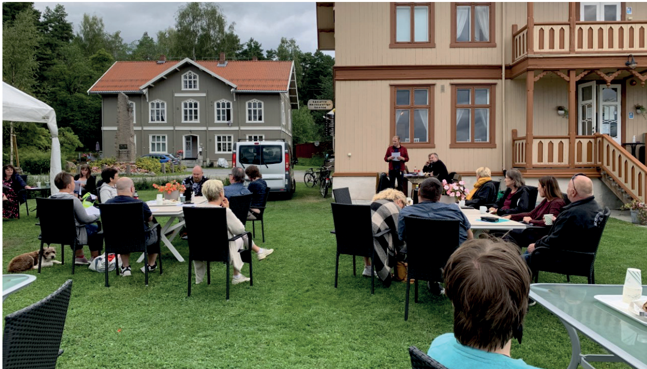
Fra Fellesmøte som holdes hver mandag kl 12.30.

2021 har som 2020 vært et spesielt år, men med god planlegging og tilrettelegging innenfor de til enhver tid gjeldende smittevernregler, har vi klart å gi et tilbud til nesten like mange personer som i 2019. Tilbudet har vært redusert, men alle har hatt et reelt tilbud om minst en aktivitet og et møtepunkt i løpet av uka. Det er ikke så stor nedgang på antall brukere som har benyttet huset, men en reduksjon på antall ganger man har hatt et tilbud pr. uke. I 2021 har vi sett at mange flere har kommet for å bruke en aktivitet og ikke bare komme på besøk. Dette er noe vi har oppmuntret til og derfor en gledelig utvikling.