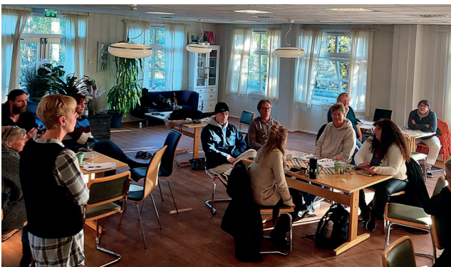
Fra Recoverykurs på Nesodden.

” Nyttig informasjon om brukermedvirkning, og refleksjonsgrupper som virkelig gav meg noe!»