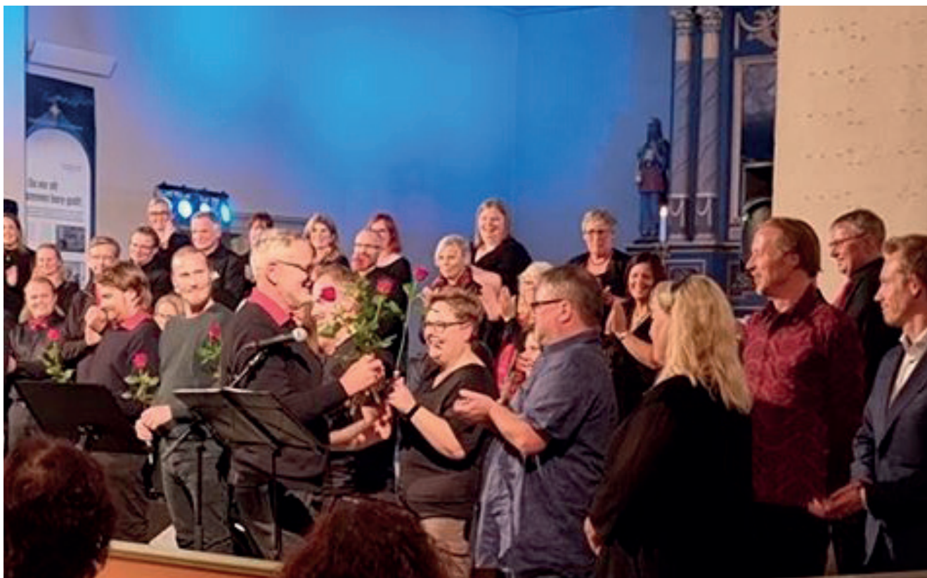
Fra konserten med Solheimkoret i Vang kirke.