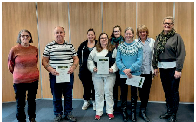
Fra Selvstyringskurs i Åsnes.