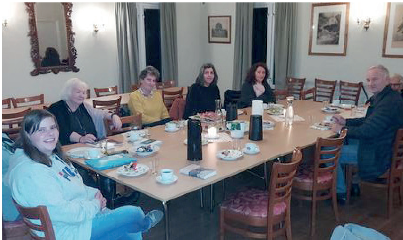
Fra Pårørendekveld på Storhamarstuene.

Pårørendecafeen er et støttende fellesskap for mennesker som er pårørende til noen som har psykisk helse og/eller rusutfordringer.