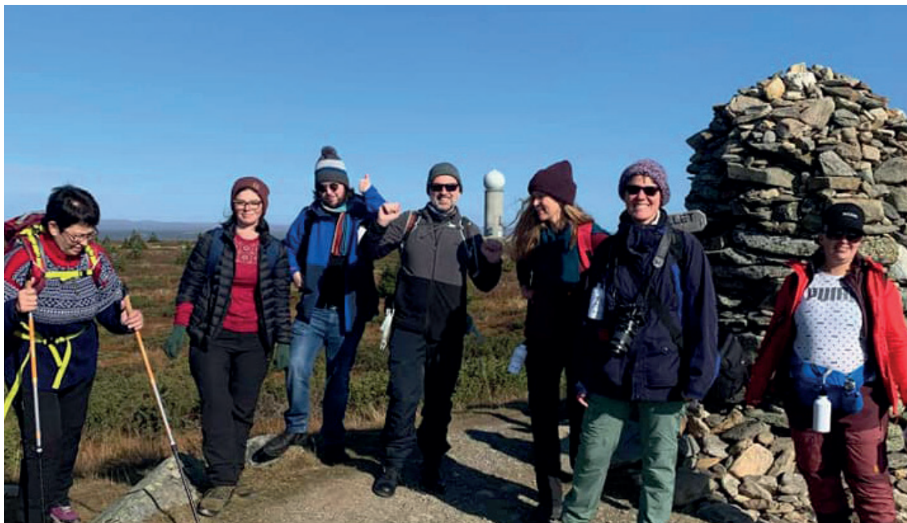
Fra turen til Pellestova.