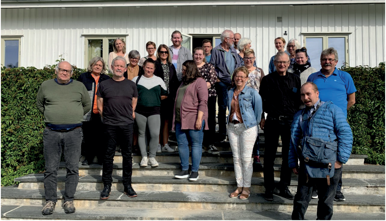
Fra kurs i samarbeidsbasert forskning på Domkirkeodden.

Sagatun har et bredt samarbeid med utdanningsinstitusjonene i innlandet om utvikling og formidling av kunnskap i et brukerperspektiv. Sagatun har inngått samarbeidsavtale med Høgskolen i Innlandet. Samarbeidet innebærer styrking av brukerperspektivet inn i utdanning og forskning slik at pasientens og brukernes behov i større grad styrer innholdet i helse – og omsorgstjenestene. Sagatun bidrar til at brukerkunnskap er inkludert i undervisning, forskning og tjenesteutvikling. I retur får Sagatun kjennskap til nyere forskning og kompetanseheving.