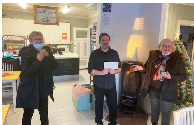
Gaveoverrekkelse fra Rebekkalosjen.