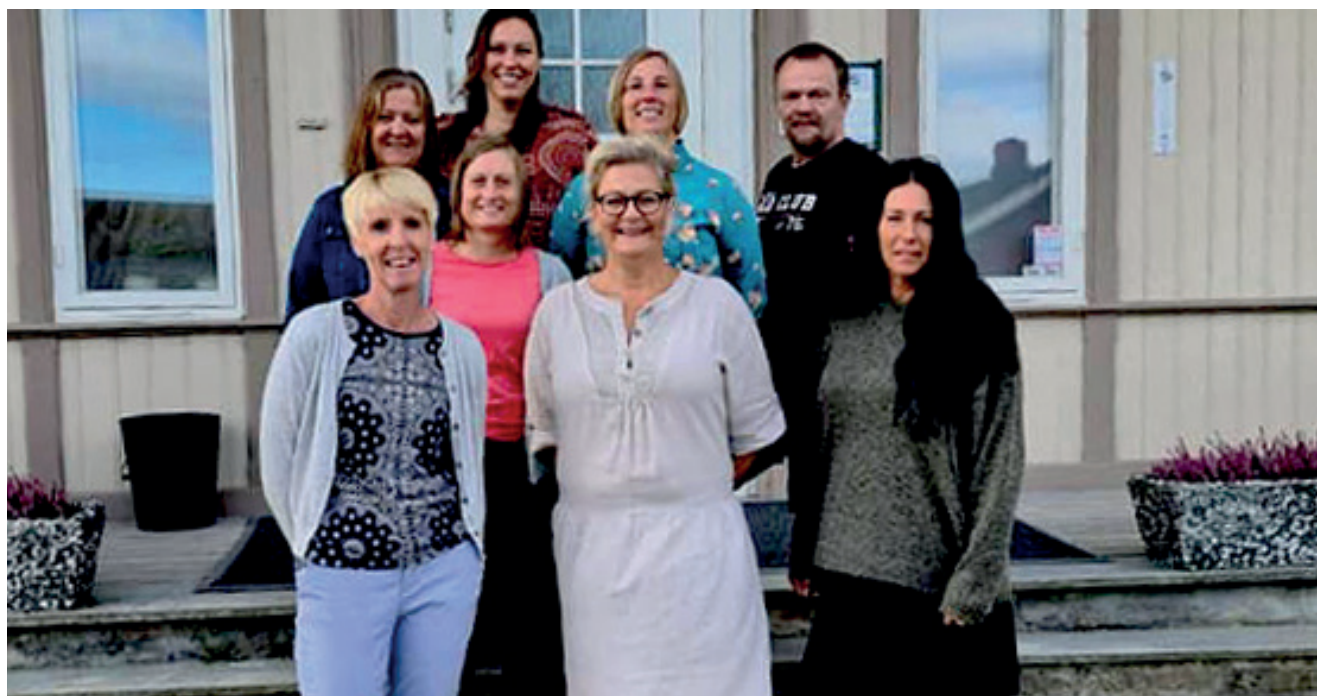
Fra Recoverykurs i Åsnes.

Verktøykassa er basert på erfaringskompetanse og likepersonsarbeid. Metodikken som brukes er hentet fra empowerment og opplevelsesbasert læring. Verktøykassa har siden 2010 vært på Sagatun, og er under stadig utvikling. Selvstyringskurs ble utviklet høsten 2012. I 2018 startet vi på utvikling av nåværende materiale i Verktøykassa.