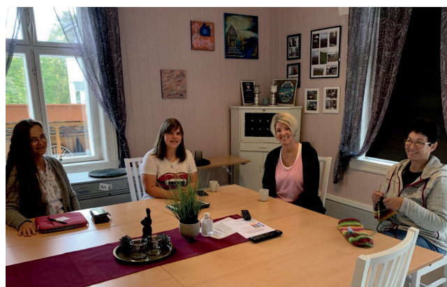
Post it gruppa.