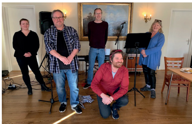
Fra Recoveryverksted i tema musikk.

Verkstedene blir gjennomført for å få økt kunnskap om hvilke faktorer som kan hjelpe den enkelte i sin bedrings- og mestringsprosess og hva som kan kjennetegne en bedringsorientert praksis. Kunnskapen og erfaringene som kommer frem på recoveryverkstedene legger vi ut på sosiale medier og egen nettside. Det blir brukt i undervisning, i arbeidsgrupper, besøk på Sagatun og i medforskning.