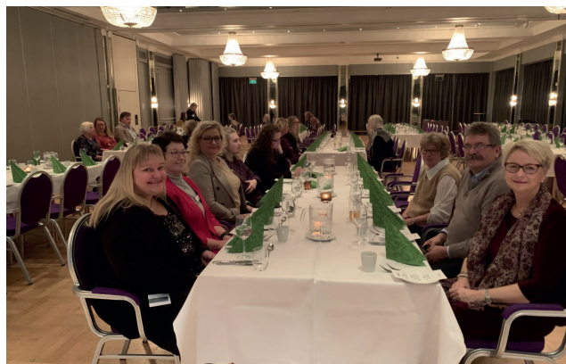
Fra medforskerkonferansen på Lillehammer.