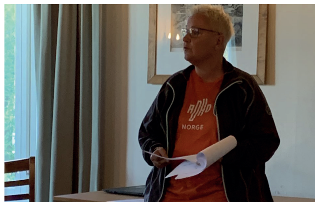
Fra temakveld om brukerorganisasjonenes arbeid. Mental Helse Hedmark , RIO, LPP og ADHD Innlandet.