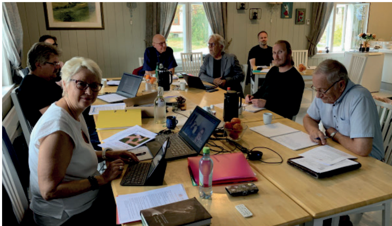
Stiftelsesstyret på Sagatun.