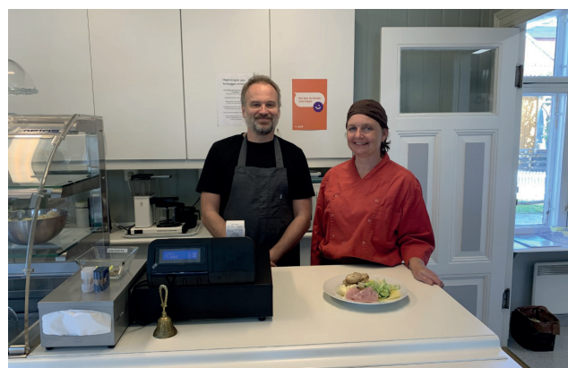
Sagatun spiseforretning og kafé.