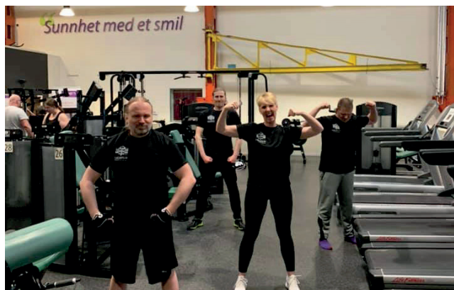
Fra trening på Espern.