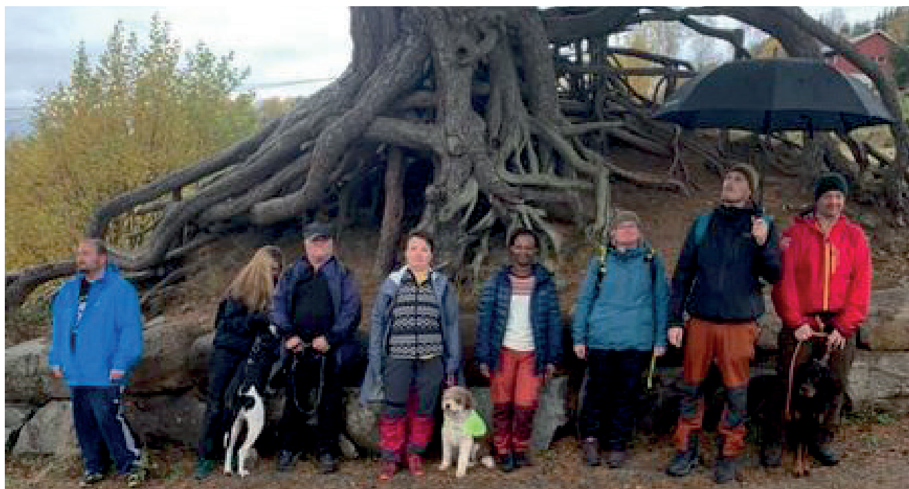
Friluftslivsgruppa på tur.