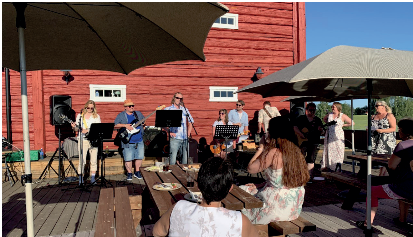
Sommerfesten på Atlungstad med musikale innslag av Sagarockers med flere.