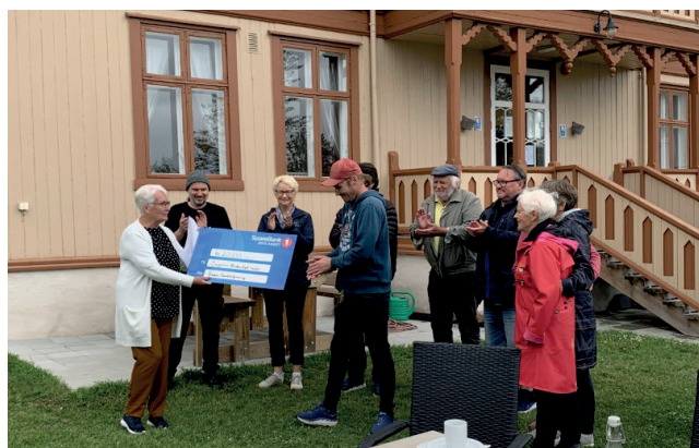
Gaveoverrekkelse på 20.000,- kroner fra Sanitetskvinnene.

Sagatun er veldig takknemlige for alle støtte, både økonomisk og på andre måter, gjennom 2021!