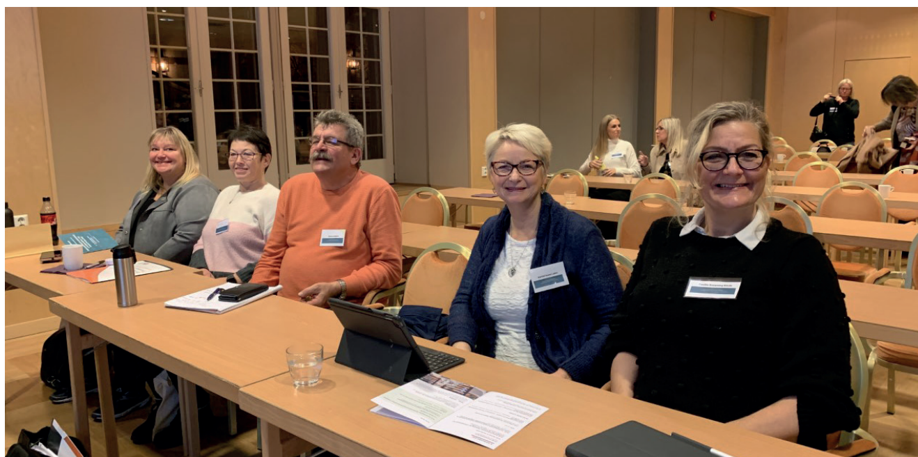
Fra medforskerkonferansen på Lillehammer.

Kurs for ansatte i offentlige anskaffelser i regi av Virke den 14.03.21.