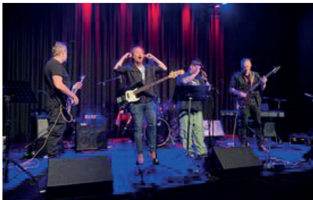
Fra konserten Rockovery.2021.

En viktig del av dette konseptet er å gi mennesker som liker å drive med musikk en profesjonell scene å stå på, samt mulighet til å uttrykke seg gjennom instrumentering, sang og/eller samspill. Tanken er at aktiv deltagelse i en recovery-orientert kontekst gir mulighet for mestring, glede, samt mulighet til å vise sine musiske ressurser i et sosialt felleskap. Rockovery-festivalen er også en møteplass for folk som er særlig interessert i musikk, hvor man kan utveksle historier og inspirasjon til hverandre i form av ens egen reise og bedringsprosesser.