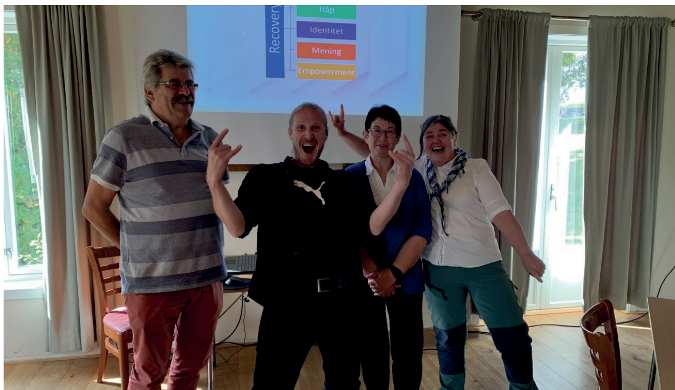
Fra Recoveryverksted i tema "En introduksjon til recovery" på Storhamarstuene.