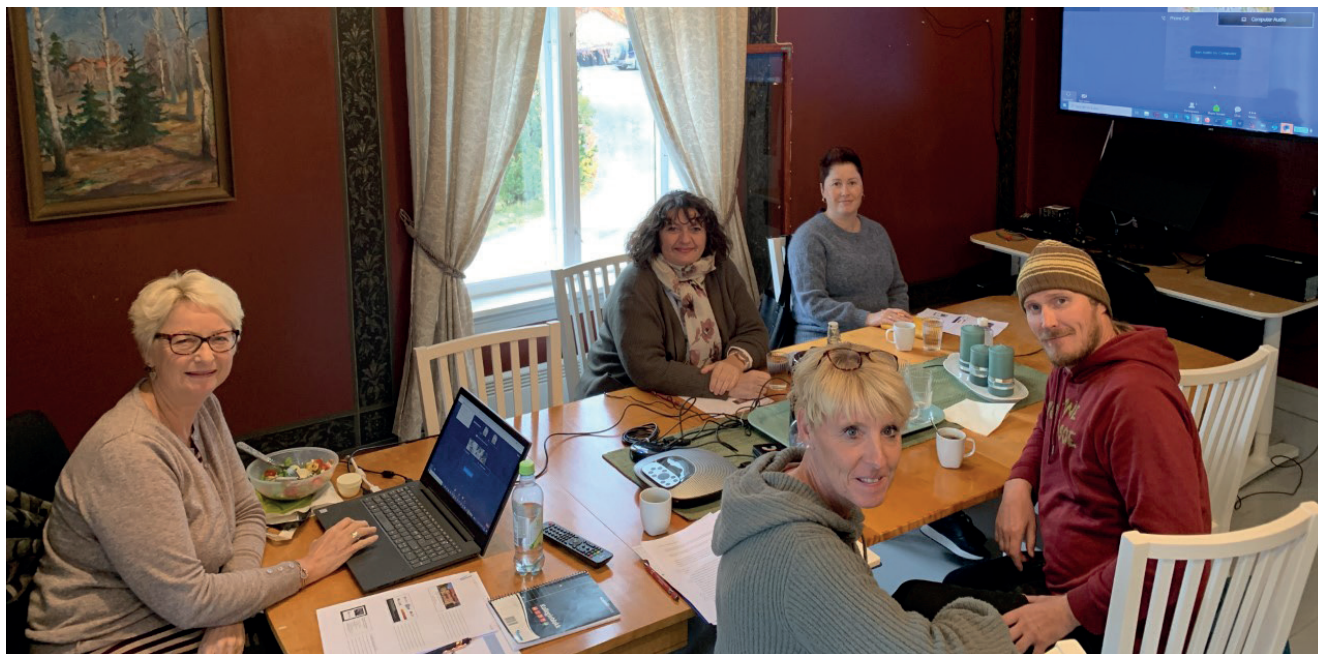
Undervisning av studenter på Sagatun.

Sagatun har ikke hatt studenter i praksis innværende år på grunn av korona, men vi har hatt undervisning flere steder med ulike tema knyttet til brukermedvirkning, recovery og empowerment. Fra Sagatun er det alltid en fagperson og en eller flere med brukererfaring som holder undervisningen. Fra studenter får vi alltid tilbakemelding om at egenerfaring er det viktigste fordi det er kunnskap de ikke kan lese seg til. Ellers er det også veldig viktig å knytte teori og erfaring sammen.