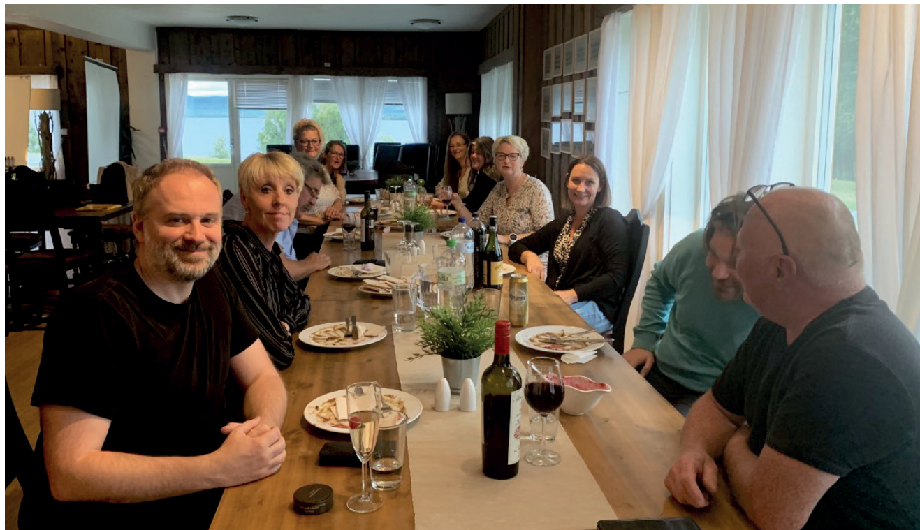
Fre personalseminaret på Osensjøen.

Sagatun har hatt et stabilt og godt arbeidsmiljø i 2021, hvor det har vært lagt stor vekt på å ivareta det psykososiale arbeidsmiljøet gjennom et krevende år. Vi har heldigvis unngått permitteringer.