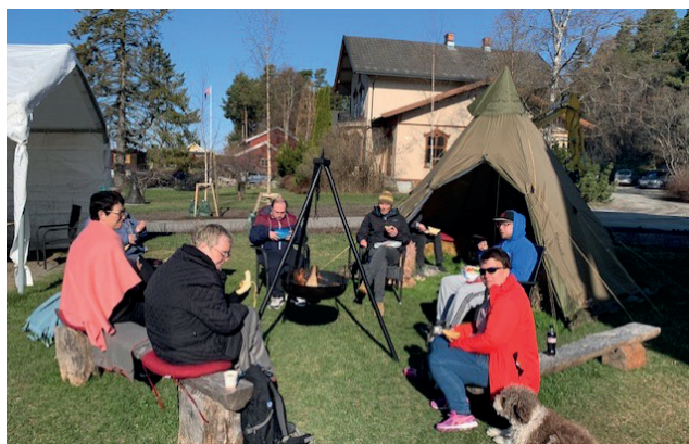
Fra #Opp om morran.