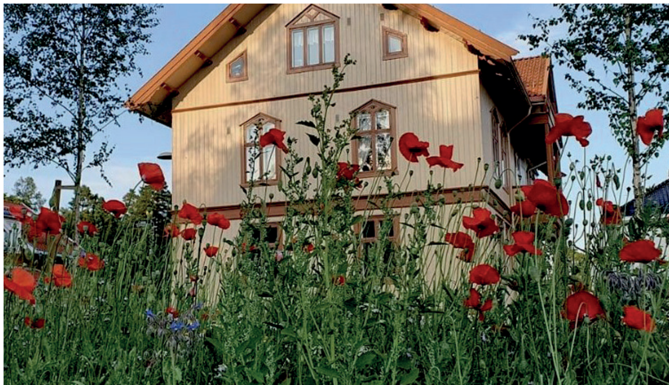
Sagatun Brukerstyrt Senter.