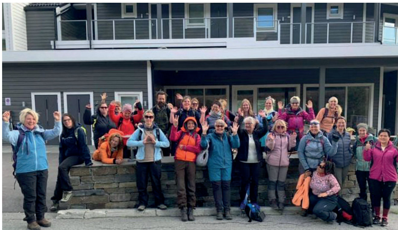
Etter turen til Hallingskarvet, alle var fornøyd etter dagens innsats.

i det vi forserte trappetrinn etter trappetrinn. Da toppen ble nådd var det bare smil å se. Noen valgte å gå ned samme vei tilbake, andre valgte å gå rundt. Uansett kjente alle på mestring og felles glede ved å gjennomføre denne turen. Det var bare smil og solrøde fjes å spore ved middagen den kvelden. Disse turene gir så mye mere enn bare selve gåturen. Det gir mestring og glede i hverdagen som vi alle lever lenge på.