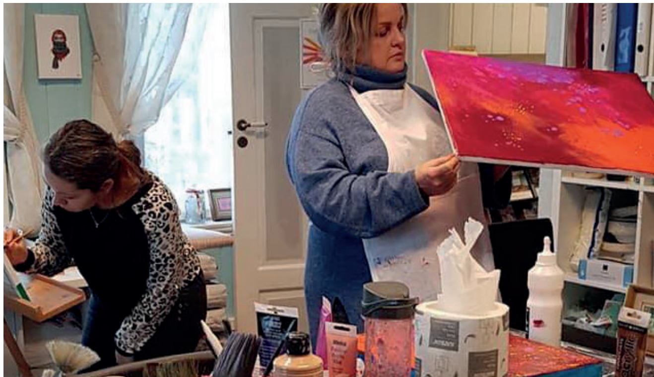
Fra Kreativt verksted; malegruppa.

Kreativt verksted har som alle andre, hatt et utfordrende år i 2021. Vi er et samlingsted for kreative personer i Hamar og omegn og dette har vært veldig viktig å opprettholde i et utfordrende år. Gjennom hele året har vi klart å holde kontakten med brukerne via telefonsamtaler og meldinger for de som har trengt det mest.