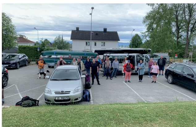
Fra sommerferieturen til Osensjøen.