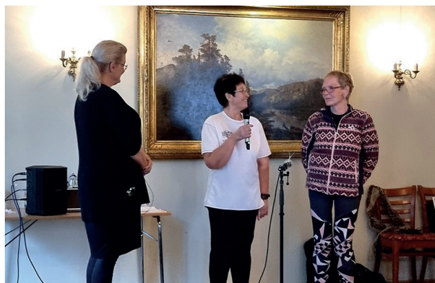
Fra Recoveryverksted i tema